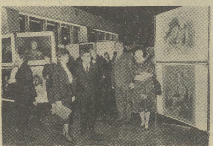
Minister kultury i sztuki prof. Aleksander Krawczuk podczas otwarcia galerii „Centrum” w NCK.

(Inf. WL.) Plany budowy domu kultury w najmłodszej dzielnicy Krakowa, Nowej Hucie, sięgają lat pięćdziesiątych, że przypomnę choćby organizowane slyne wtedy konkursy plastyczne młodzieży na temat wyobrażeń o przyszłych tego typu placówkach. Budowniczym Nowej Huty marzył się nowoczesny obiekt, w którym młodzież miałaby zapewnione zajęcia kulturalne i rozrywkę. Ustalono nawet miejsce jego wzniesienia — na skarpie przy placu Centralnym od nie zabudowanej strony południowej. Ale wciąż było coś pilniejszego więc czekano na lepsze czasy. Dopiero grudniowy przełom przyniósł