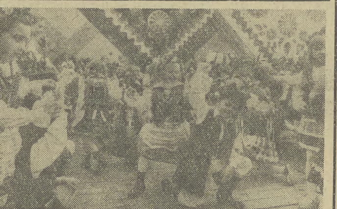
„Wianek krakowski” w wykonaniu przedszkolaków zainaugurował Targi Sztuki Ludowej.