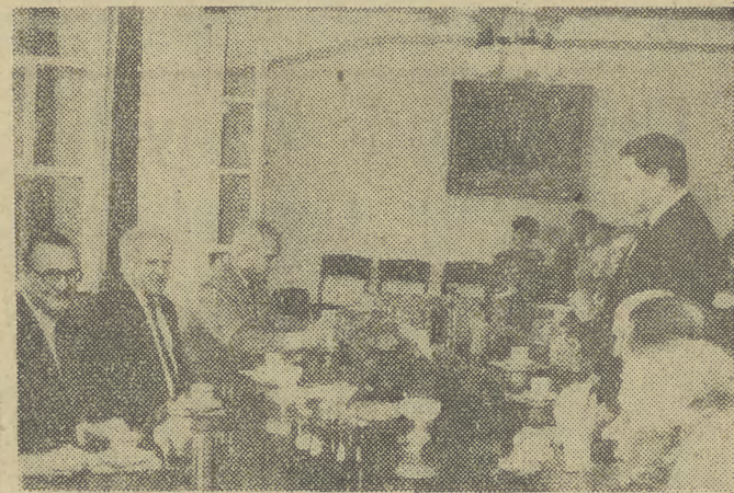
Spotkanie w KK PZPR.