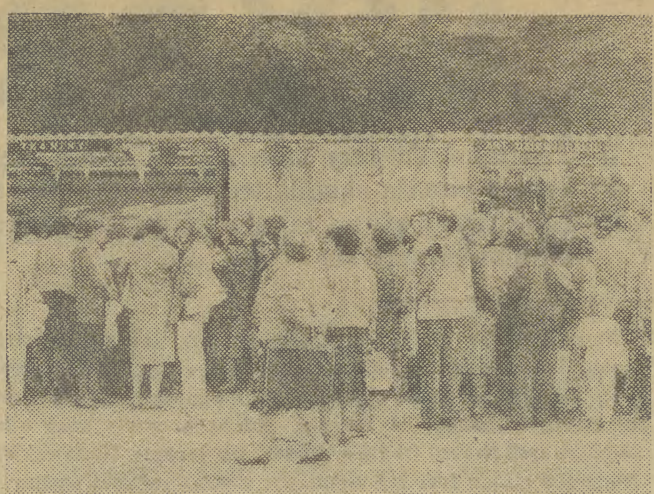
Jarmark w Wieliczce

Wiceprezes Malec oświadczył, że porozumienia dają gospodarce polskiej pewien oddech na najbliższe lata, gdyż przesuwały spłatę ok. 1,6 miliarda dolarów.