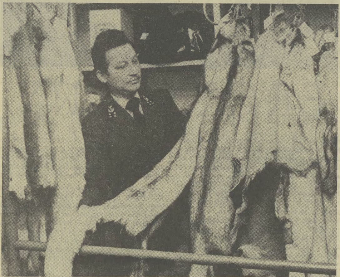
Na granicy sezon na lisy rozpoczyna się jesienią...