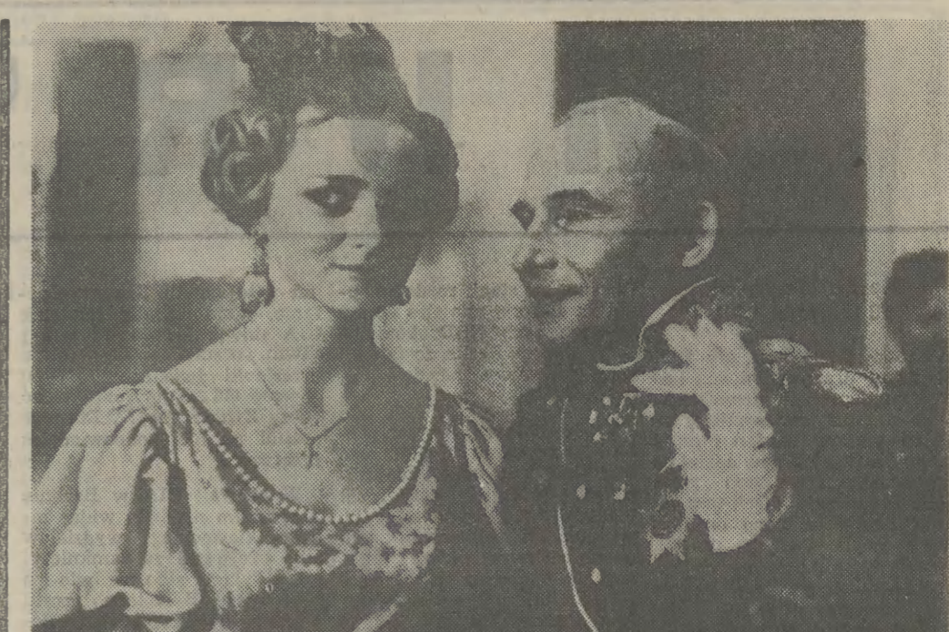
Kadr z filmu „Opowieść o «Dziadach» Adama Mickiewicza «Lawa»”