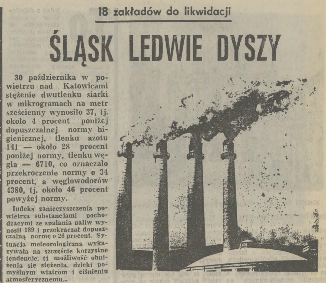
18 zakładów do likwidacji