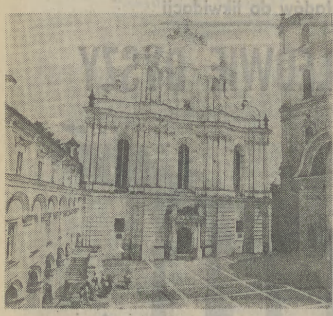
Kościół św. Jana w Wilnie, tu bywał m. in. A. Mickiewicz