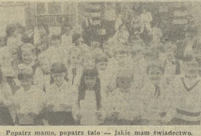
Popatrz mam, popatrz tato — Jakie mam świadectwo.