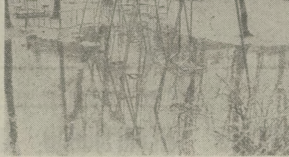
A tak wygląda po deszczu plac zabaw przy ul. Bożego Ciała. Co na to gospodarze?

jak w Starej Olszy na 23 ulice i 4,5 tys. mieszkańców — placu zabaw nie ma ani jednego. Osobnym problemem są ośrodki spółdzielcze. Na terenie w/w, krakowskiego mieszkawców ok. 370 tys. mieszkańców, w tym ok. 130 tys. dzieci do lat 15. W projektowaniu osiedli mało uwagi poświęca się jednak terenom rekreacyjnym dla młodzieży. Dają one o sobie również trudności gospodarce spółdzielni mieszkaniowej —