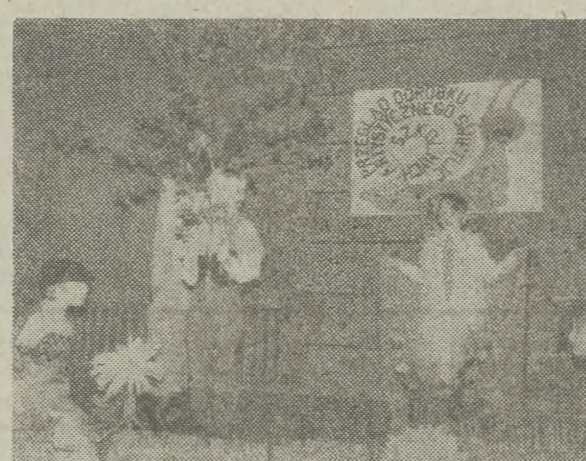
Przez trzy dni w Szk. Podst. nr 148 trwał konkursowy przegląd dorobku artystycznego świetlic szkolnych dzielnicy Podgórze. Zorganizowany został przez Wydział Oświaty i Wychowania Ud Kraków-Podgórze, Ośrodek Doskonalenia Nauczycieli i MDK im. I. Gałęzianki. W konkursie uczestniczyło 15 zespołów działających w ramach świetlic szkolnych: w klasach I—IV. Konkurs odbywał się w kategoriach: zespołów tanecznych, teatralnych, rozpięwanych grup dziecięcych, konkursu kronik świetlicowych, w dziedzinie plastyki i zajęć techniczno-praktycznych. Wszystkie zespoły biorące udział w konkursie otrzymały dyplomy a zwycięzcy zostali: świetlica ze Szkoły nr 148, która otrzymała puchar inspektora oświaty i wychowania Ud Podgórze oraz świetlica Szkoły nr 90, która otrzymała nagrodę inspektora w wysokości 300 tys. złotych.

Chyba do historii należą te czasy, gdy na tandecie można było upolować jakąś okazję w postaci taniego zachodniego ciucha wprost z paczki. Dziś takowy bez względu na to w jakim stanie się znajduje trzeba słono płać. Najlepszym tego dowodem są używane swetry wełniane, które oferują się w cenie od 10 aż do 40 tys. zł. Dla porównania nowe, ale za to турецkie, czarno-biało-popielate sweterki można kupić za 27—35 tys. zł, jednak są one coraz mniej chodliwym towarem. Na dobrą sprawę to samo można by powiedzieć o dzinsowych szlafkach ubrankach (spodnie — 20—36 tys. zł, spodnie