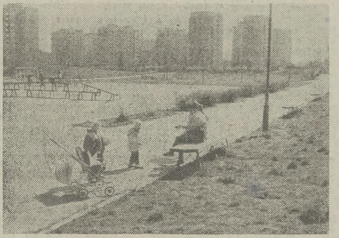
Tu można odpocząć razem z dzieckiem — jest plac zabaw i laweczki dla dorosłych. Zadbane tereny należą do os. XXX-lecia.

coraz mniej jest funduszy na sierść opiekuńczą i wychowawczą. Są więc osiedla spółdzielcze, na których jak wos. Ruczaj placów zabaw wcale nie ma, a także i takie, w których liczba placów w stosunku do ilości zamieszkałych w nich dzieci jest znikoma. I tak np. w os. Bieżanów Nowy na jeden plac zabaw przypada 2600 dzieci, w os. Wysokim — 1670 a w os. Dąbrowszczyków — 1637. Trzeba tu zauważyć, że dzieci te mieszkają przecież w dużej odległości od centrum kulturalnego miasta i są w ten sposób całkowicie zdane na siebie i na bazę rekreacyjną również przełożonych szkół i przedszkoli. Sytuację pogarsza dodatkowo fakt, że spośród ogólnej ilości istniejących w osiedlach placów zabaw ponad 68 proc. ma bardzo skromne wyposażenie, nie przekraczające nielicznych uprzążeń!