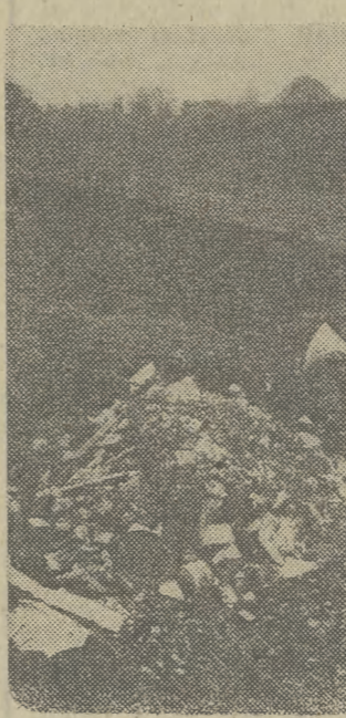
Pod kopcem Kościuszki.

Przykłady można mnożyć. Nie miejsce podobnych do prezentowanych na zdjęciach straszny w naszym mieście. Czy tak przywykliśmy do brudu i bałaganu, że przestal on kluczyć nas w oczy? Czy bardziej winni są ci, którzy nie sprzątają a powinni, czy ci