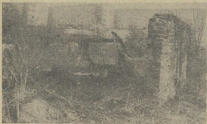
Przy ul. Malborskiej.