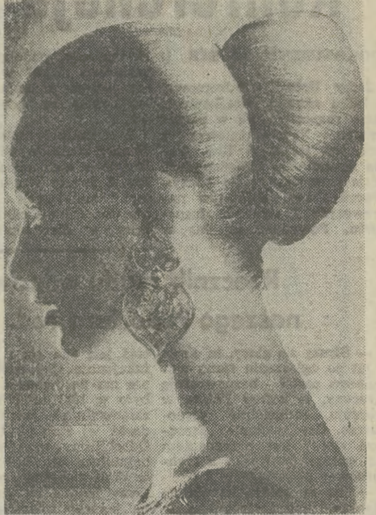
JEDEN z największych fryzjerów naszych czasów ciągle pozostaje na szczycie. Jego umiejętności, talent i artystyczny zmysł nieustannie frapują oglądających jego dzieła. Indywidualny styl Alexandre'a sprawił, że czterech wielkich kreatorów mody zamówiło u niego fryzury dla swych wiosennych i letnich kolekcji 1989.

Zasadniczym elementem, składającym się na całość kobiecej sylwetki jest makijaż. W każdym calu jest on tego roku dostosowany do typu wyznaczonego przez strój. Także proste, nieskomplikowane, także mało rzucające się w oczy. Oczywiście podkreślone ołówkiem lub ewentualnie pastelowym cieniem, białej podkład i puder, prawie w ogóle nie zaznaczone policzki — róż trzeba będzie więc odłożyć zupełnie albo używać bardzo delikatnie.