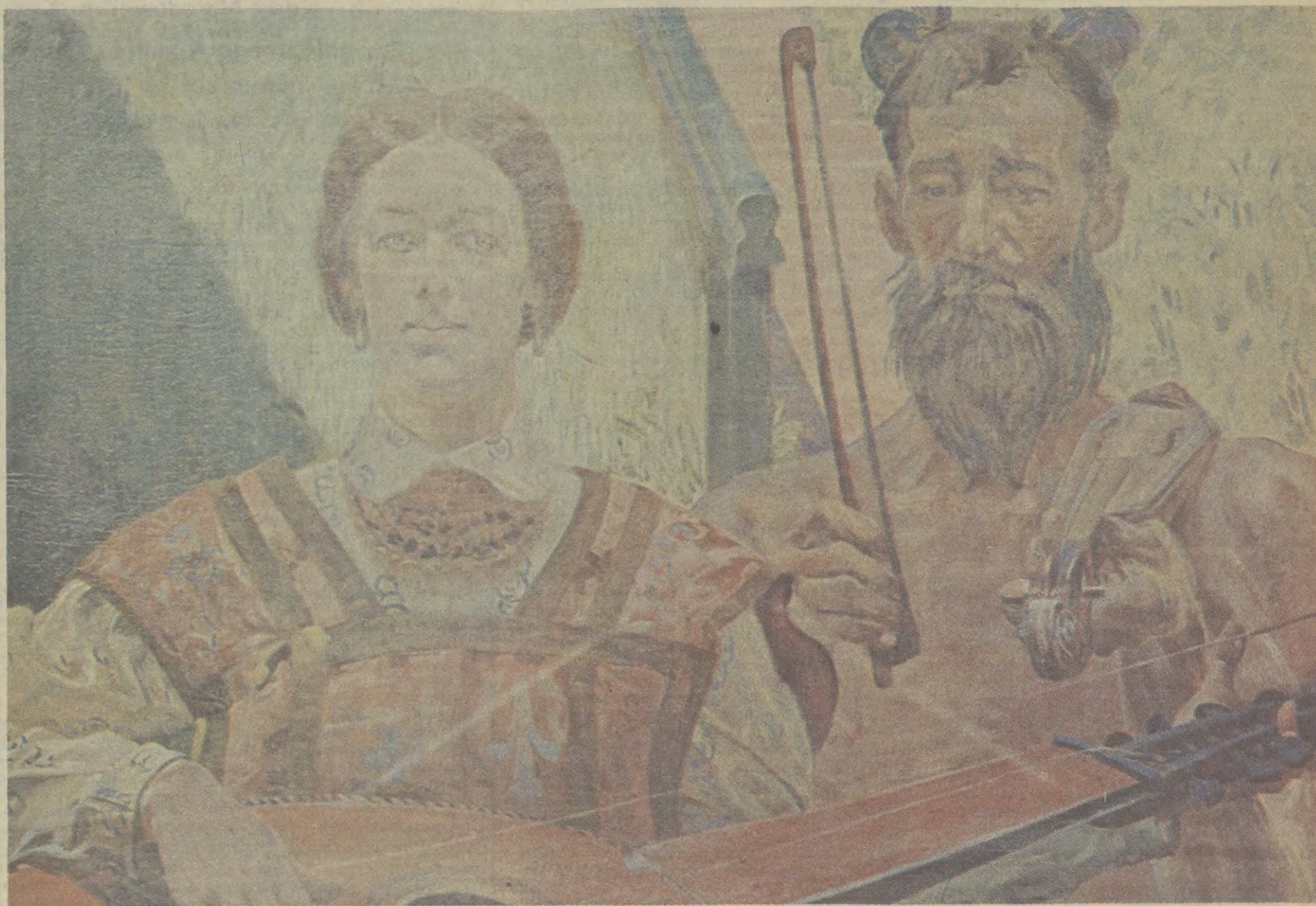
Jacek Malczewski - Koncert II - 1905 r.