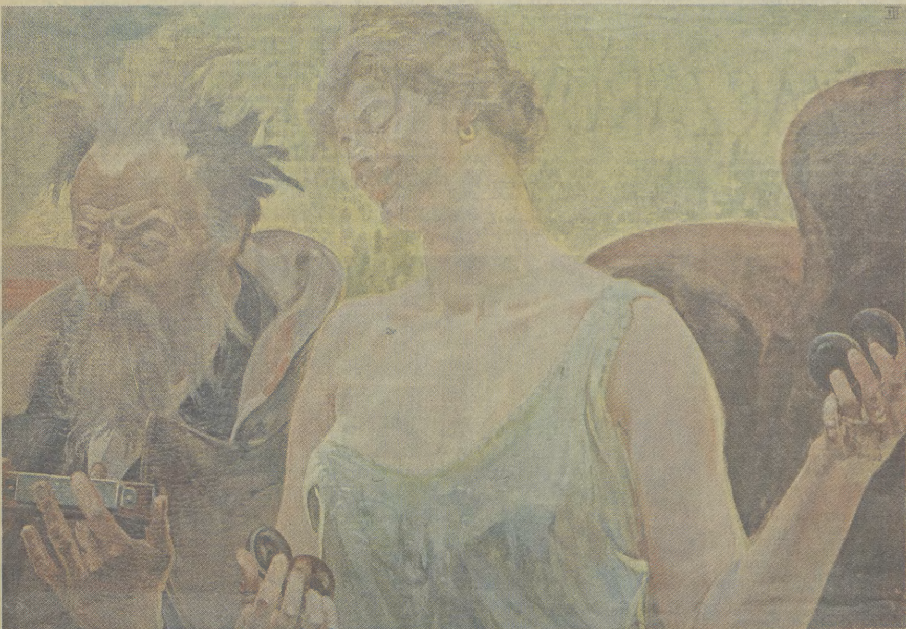
Obrazy pochodzą ze zbiorów Towarzystwa Przyjaciół Sztuk Pięknych w Krakowie. (fotogramy wykonał Konrad Pollesch)