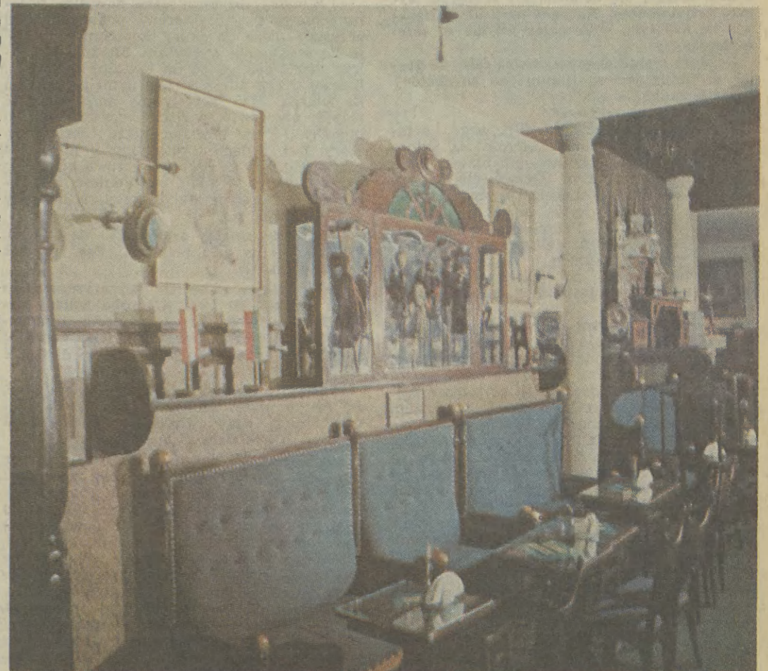
Jamę Michalikową i zabytkowy zegar

Boy był drugim dzieckiem niezwykle małżeństwa krakowsko-warszawskiego. Ojciec Władysław, pochodził ze starej rodziny mającej posiadłość