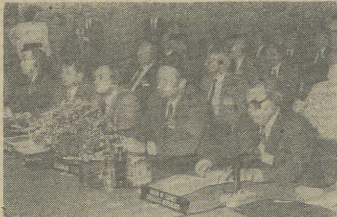
W obradach XVI Europejskiej Konferencji Regionalnej FAO w charakterze obserwatorów udział biorą przedstawiciele Australii, Kanady, USA, NRD, Białoruskiej i Ukrainiejskiej SRR, ZSRR oraz Watykanu. Na zdjęciu: obserwatorzy w sali obrad.

Zwraca uwagę dużą aktywność prac konferencji. Krakowskie spotkanie rzeczywiście zastępuje na określenie europejskiego szczytu rolniczego z uwagi na fakt, że na czele znacznej liczby delegacji krajowych stoją ministrowie rolnictwa. Wyróżnia to zdecydowanie krakowską konferencję. (DOKOŃCZENIE NA STR. 4)