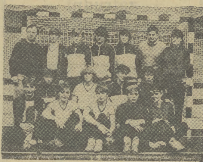
Grupa zawodniczek i trenerów Cracovii zdobywczyń srebrnego medalu.

Wczorajszy mecz Cracovii z nowo kreowanymi mistrzyniami AKS Chorzów nie miał już żadnego znaczenia dla układu tabeli, chociażby tylko o pres-