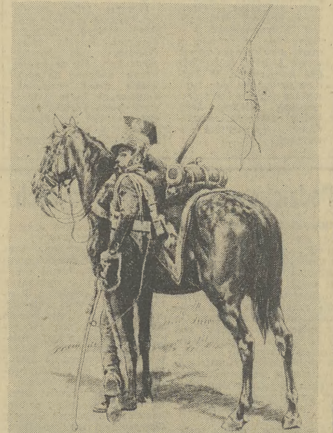
Obraz Polaka z czasów Kr. Wierocławskiego.

Od jutra kalendarz (w dwóch częściach) do nabycia we wszystkich kioskach „Ruchu”.