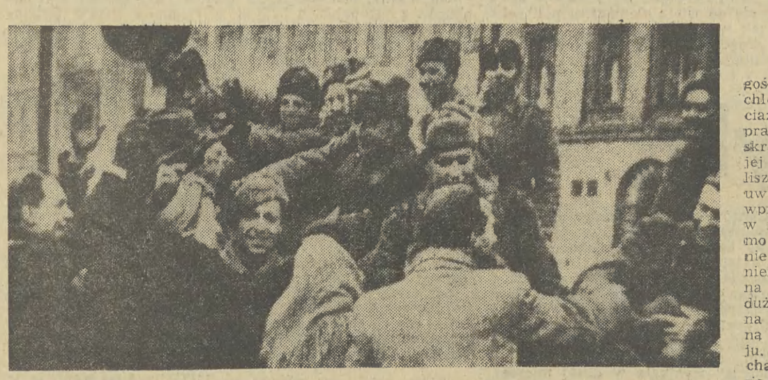
W szturmie na Kraków zginęło ich dużo, gdyż natarcie było błyskawiczne i nie szczędzili...