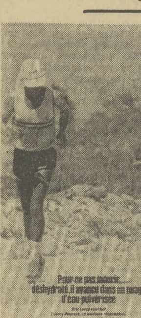
Widok ale także specjalny spryskiwacz, dzięki któremu odważnemu biegaczowi mogło się zdawać, że biega w czasie letniego deszczu.