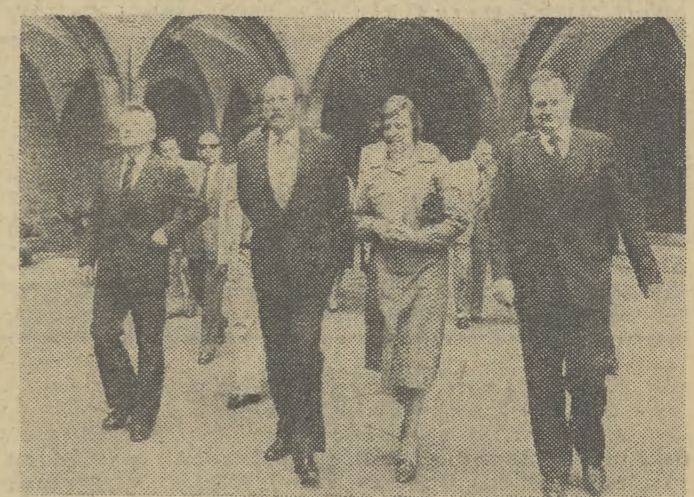
W sobotę przedpołudnie gościł z Kuby zwiędzał Kraków

(Inf. wł.) W minioną sobotę gościł na Podhalu przebywający w Polsce z oficjalną wizytą członek KC Komunistycznej Partii Kuby, minister spraw zagranicznych Isidoro Malmierca Peoli.