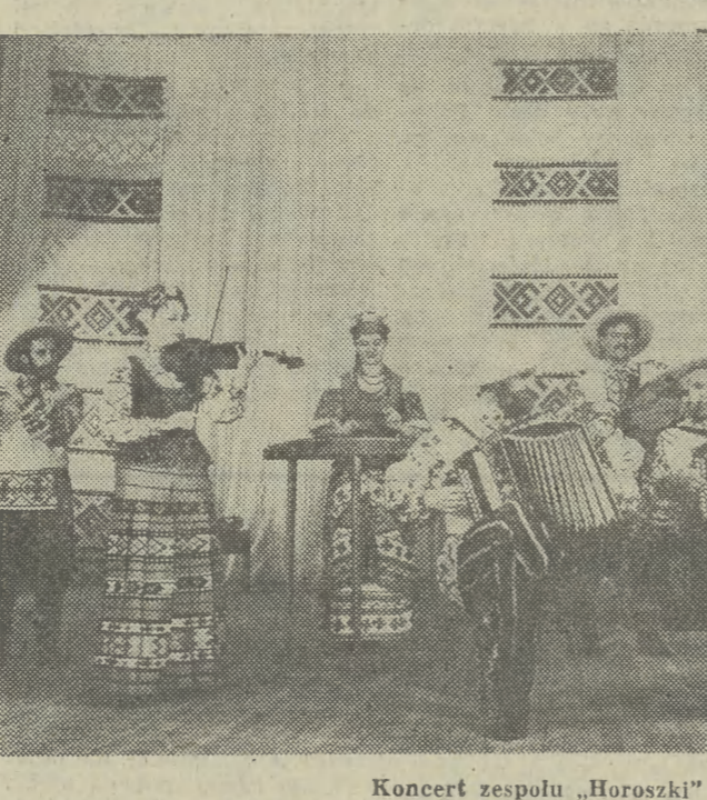
Koncert zespołu „Horoski” w Tarnowie.

W. Lenina przyjął jako jeden z pierwszych „Dekret o pokoju”. Ta właśnie droga, drogą walki o pokój kroczyliśmy nadal. Związek Radziecki propozuje zamrożenie arsenałów nuklearnych, zaprzestanie rozmieszczenia rakiet i osiągnięcie redukcji nagromadzonych zbrojeń.”