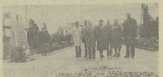
Delegacja uljanowskich związkowców przed pływakiem Nieznanego Żołnierza na cmentarzu Zasłużonych w Nowym Sączu.

WARSZAWA (PAP). Prezes Rady Ministrów gen. armii Wojciech Jaruzelski powołał zespół roboczy złożony z przedstawicieli rządu i Rady Krajowej PRON dla opracowania wniosków wynikających z przebiegu wspólnego posiedzenia Prezydium Rządu i Prezydium Komitetu Wykonawczego Rady Krajowej PRON odbytego 15 kwietnia. Kierownictwo zespołu prezes Rady Ministrów powierzył wicepremierowi Rady Ministrów — Mieczysławowi F. Rakowskiemu. Opracowane wnioski zostaną przedłożone Radzie Ministrów.