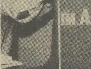
5 kwietnia 1945

stawię prozy pisarza. Ciekawa propozycję zgłosiła też córka autora „Panien z Wilka”. Przedstawiła projekt wystawienia we wnętrzach rodzinnego domu „Lata w Nohant”.