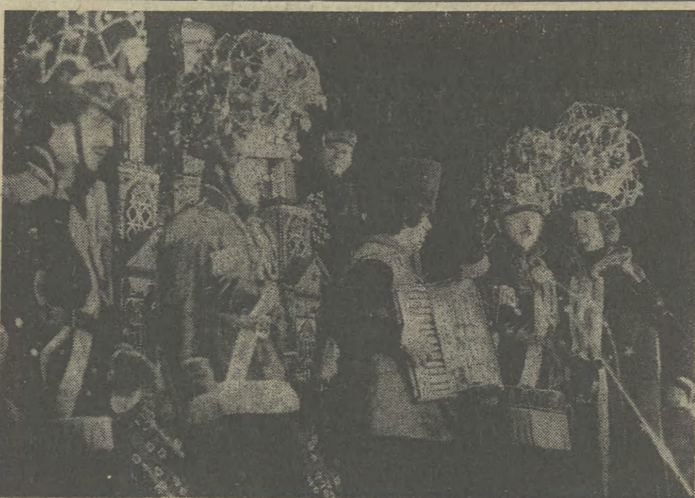
Tradycja stała się już, że w okresie karnawału krakowski Teatr Regionalny wspólnie z Estradą Krakowską organizują występy grup kółkowych z okolic Krzczowa, Limanowej, Lubnia, Niedźwiedzia i innych. „Szopkę Krakowską“, bo tak zatytułowany jest program, można oglądać w sali klubu ZZK przy ul. Filipa. Na zdjęciu: jedna z grup kółkowych podczas występu pod pomnikiem A. Mickiewicza.

środkiem transportu — poza barkami wiatłami — nie zdoła w przyszłości zaopatrzyć w węgiel elektrownie w Skawinie i w Legu, a w przyszłości — mającej powstać elektrownia „Tarnów“. Co więcej, z budowanej kopalni „Czeczoł“ nie przewiduje się innego sposobu wywozu węgla jak tylko drogą wodną. Do tego rodzaju transportu dostosowane będą również kopalnie „Ziemowit“ i