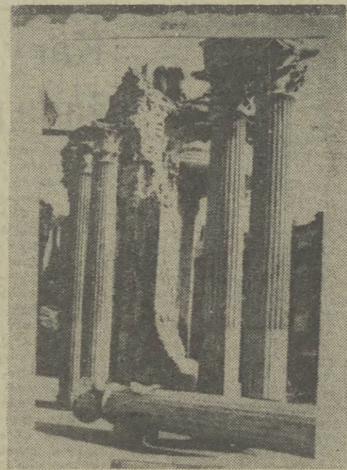
Zdjęcie J. Bułhaka reprodukowal Otto Link