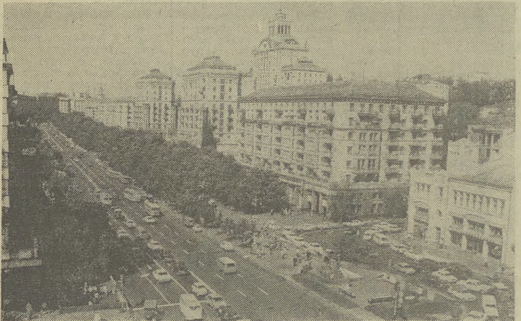
KIJÓW — Kreszchatyky