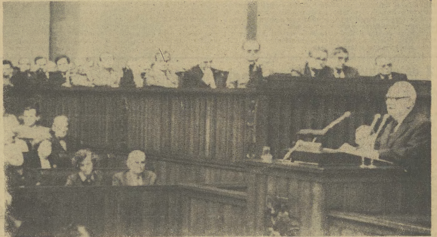
Wczoraj rozpoczęły się dwudniowe obrady Sejmu PRL. Na zdjęciu: przemawia Henryk Jabłoński.

Występując w imieniu Klubu Poselskiego Stronnictwa Demokratycznego pos. Jan Fa-