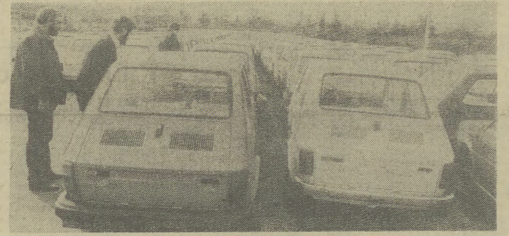
Samochód — nie zawsze ten drogi i ten nowoczesny — ale ten popularny, nasz maluch, czyli „fiat 126 p”, jest przedmiotem marzeń przeciętnego Polaka.

Komisja inicjująca utworzenie Tymczasowej Rady Krajowej Patriotycznego Ruchu Odrodzenia Narodowego uważa, że swoje naczelne zadanie odbudowania wzajemnego zaufania wszystkich Polaków, dla których drogą są ideały niepodległości, sprawiedliwości społecznej i socjalistycznej demokracji, zwraca się do Sejmu Polskiej Rzeczypospolitej Ludowej z apelem o jak najszybsze uchwalenie zakończenia w całym kraju stanu wojennego wprowadzonego w dn. 13 grudnia 1981 r.