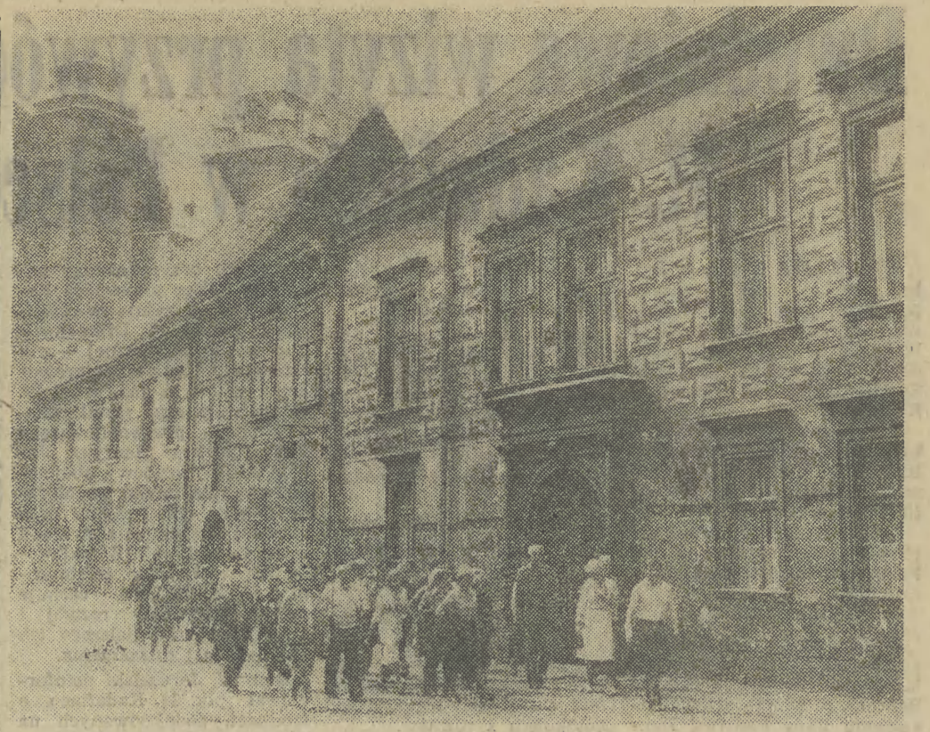
Tradycyjny szlak turystów odwiedzających Kraków wiedzie z Wawelu ulicą Kanoniczą do Rynku.