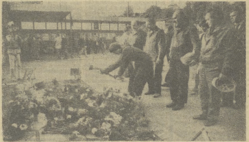
W drugą rocznicę podpisania porozumienia szczytuńskiego, przedstawiciele kierownictwa społeczno-gospodarczego oraz poszczególnych wydziałów Stoczni Szczecińskiej im. A. Warskiego złożyli wiązanki kwiatów pod tablicą pamiątkową, znajdującą się przy bramie głównej (na zdjęciu). Również w Gdańsku, pod pomnikiem Stoczników kwiaty złożyła delegacja Wojewódzkiej Rady Patriotycznego Ruchu Odrodzenia Narodowego.