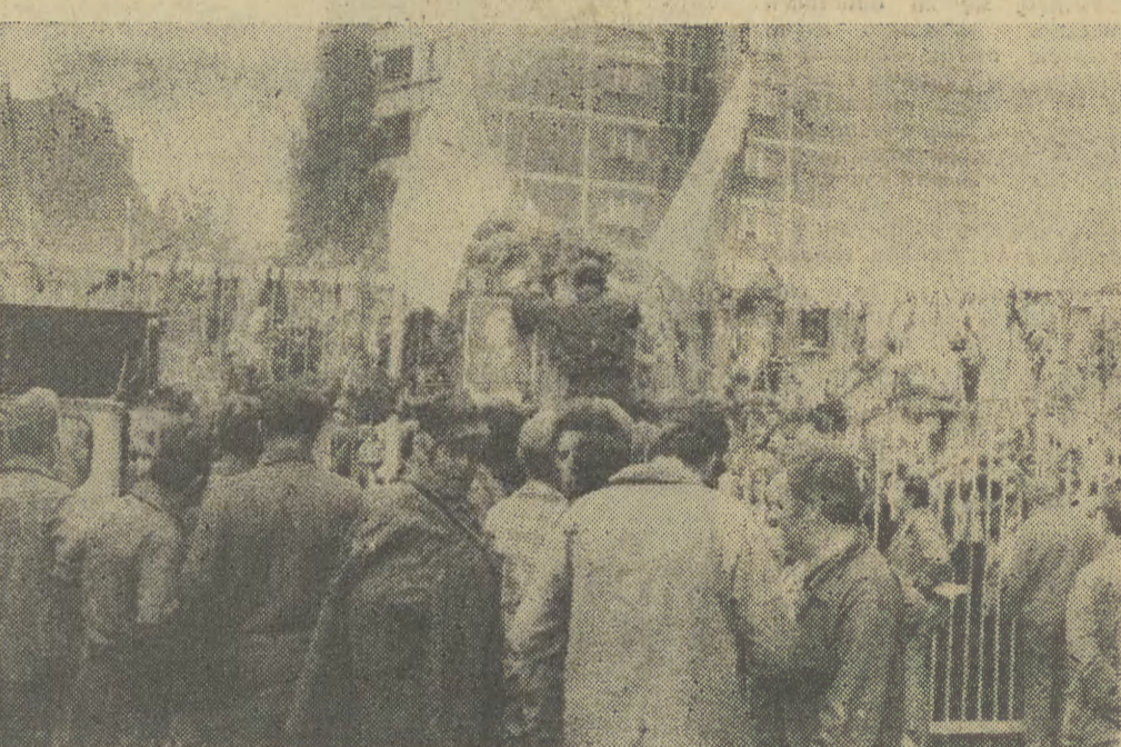
Gdy podpisano porozumienia