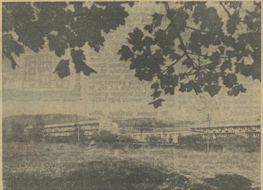
Złockie kolo Muszyn — to urodzisko dopiero zyskuje sławę dzięki doskonałemu klimatowi oraz odwierzonym niedawno, unikatowym źródłom wód mineralnych.

KOSPAS-SARSAT jest systemem otwartym dla wszystkich. W początkowej, eksperymentalnej fazie realizacji projektu oprócz ZSRR, USA, Kanady i Francji uczestniczyć będą Norwegia i Wielka Brytania. Parę innych krajów rozważa zgłoszenie akcesu do systemu. Być może w niedalekiej przyszłości we wspólnocie kosmicznego pogotowia ratunkowego połączy się większość krajów świata.