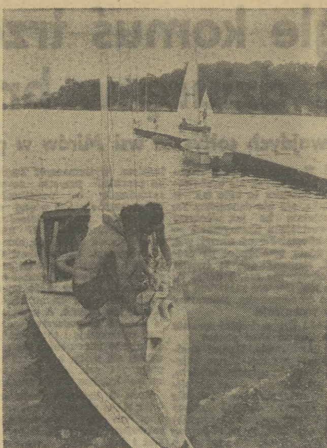
Najbardziej udany wypoczynek to ten pod flagami.