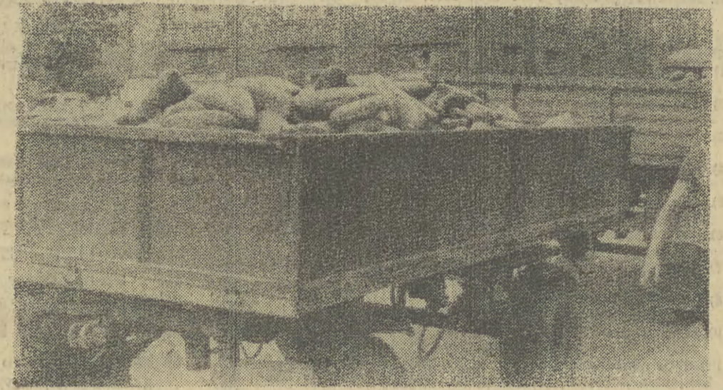
Dziwne rzeczy dzieją się w Krakowie z chlebem. Przed dniami wzięliśmy od pracy bywa, że go brakuje, kiedy indziej zaobserwować można obrázky takie jak na zdjęciu — ze sklepów wywozi się tony czerstwego pieczywa, które nie znalazło nabywców. Oczywiście nie zmarnuje się, trafi do tuczarni trzody, ale czy stać nas na to, by chlebem karmić świnie? Nie wiemy, w czym tkwi przyczyna takiego stanu rzeczy. Być może niektórzy kierownicy sklepów obawiając się iż chleba braćnicy zamawiają go w nadmiarze. Wtedy oczywiście nie starcza dla innych placówek handlowych. Obserwujemy od dłuższego czasu takie „odbioru” czerstwego chleba ze sklepów „Piast” przy ul. Boh. Stalingradu (stad też pochodzi zdjęcie) i wntośk nasuwa się jeden — więcej umiaru i handlowego wyszczuplenia! (zur)

w latach 1972—75 włącznie. Podział ten oparty jest na wewnętrznych regulaminach spółdzielni, uwzględnia też nowe wytyczne Centralnego Związku. Przyjęty okres oczekiwania i tak nie jest różnorodny z otrzymaniem w br. przydziału na mieszkanie, oczekujących jest znacznie więcej niż nowych bloków w osiedlach. O tym, komu przyznać klucze decyduje więc samorząd każdej spółdzielni, a głównym kryterium tej selekcji są obecne warunki lokalowe danej osoby. W szczególności uzasadnionych przypadkach można w ramach przyznanej puli część przeznaczyć na przyspieszenia.