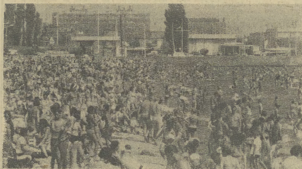
Bez pobytu nad morzem kiedyś nie wyobrażano sobie prawdziwego urlopu. Teraz wiele się pod tym względem zmieniło. Inne regiony kraju stały się równie atrakcyjne i „w modzie”. Jednak mimo obecnych trudności zaopatrzeniowych, wysokich cen wczasów i zamknięcia wielu kąpielisk ze względów sanitarnych — amatorów nadmorskiego wypoczynku nie brakuje. Np.: plaże w Trójmieście czynne są tylko w Gdyni, Sopocie i Słegach.

Dochodzenie pozwala sądzić, że z tej drogi dość często korzystali więźniowie, którzy udawali się na „gosińne występy” w okolicach więzienia uchodzącego dotychczas za obiekt „wyjątkowo dobrze strzeżony”.