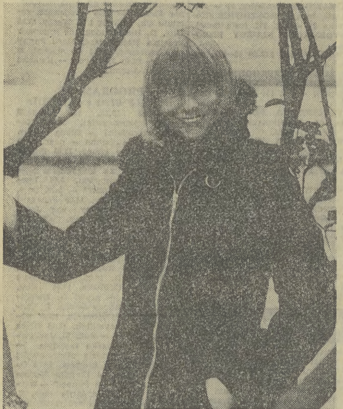
Oto propozycja „CORY” na chłodniejsze dni — sportowa kurtka z ciemnoniebieskim sztrukturalnym odcieniem kołnierza ze sztucznego futra. Modelka, oczywiście, nie wchodzi w skład propozycji.

poniosło ok. 30 osób więcej. Z aktualnych doniesień wynika również, że 29 osób zostało rannych. Rzecznik linii lotniczych oświadczył, że trzeba będzie wiele czasu dla ustalenia przyczyn katastrofy. Nie wyklucza się jednak, że pilot odrzutowca zbliżając się do lotniska w gęstej mgle mógł popełnić błąd. Zatonął on dwukrotnie koło nad portem lotniczym i przekazał wieży kontrolnej, że zorientował się na tyle w sytuacji, iż może rozpocząć lądowanie. Dwie minuty później samolot roztrzaskał się. Liczba ofiar wśród załogi fabryki byłaby znacznie wyższa, gdyby nie to, że w tym czasie była właśnie przerwa i większość pracowników udała się do pobliskiej kantyny.