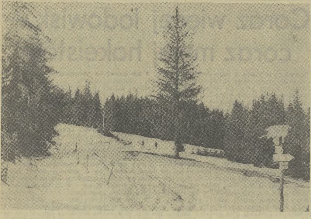
Zima na Gubałówce.

Aby poprawić sytuację, państwo rozszerzyło pomoc dla hodowców macior i producentów prosiąt oraz warchlaków, co daje już oczekiwane rezultaty. Pogłowienie macior systematycznie wzrasta. Już wiosną, a w większym stopniu latem i jesienią 1977 r. powinno nastąpić zwiększenie produkcji prosiąt, a pod koniec przyszłego roku, i bardziej odczuwalnie w latach następnym — także produkcji żywca wieprzowego. Trzeba bowiem pamiętać, że wyhodowanie tuczniaka nadającego się do uboju trwa co najmniej 6-8 miesięcy.