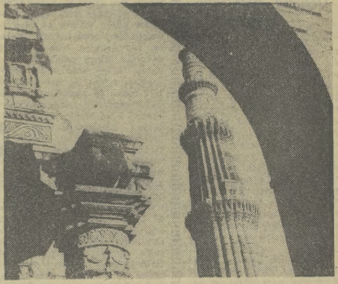
INDIE. Zbudowany w XIII wieku 80-metrowej wysokości minaret Kutub Minar w Delhi. Jak twierdzą przewodnicy — jest on najwyższą wolno stojącą wieżą na świecie.

W imieniu Biura Politycznego KC PZPR i swoim własnym I sekretarz KC PZPR Edward Gierka przekazał Le Duanowi serdeczne gratulacje z powodu wyboru na stanowisko sekretarza generalnego Komunistycznej Partii Wietnamu.