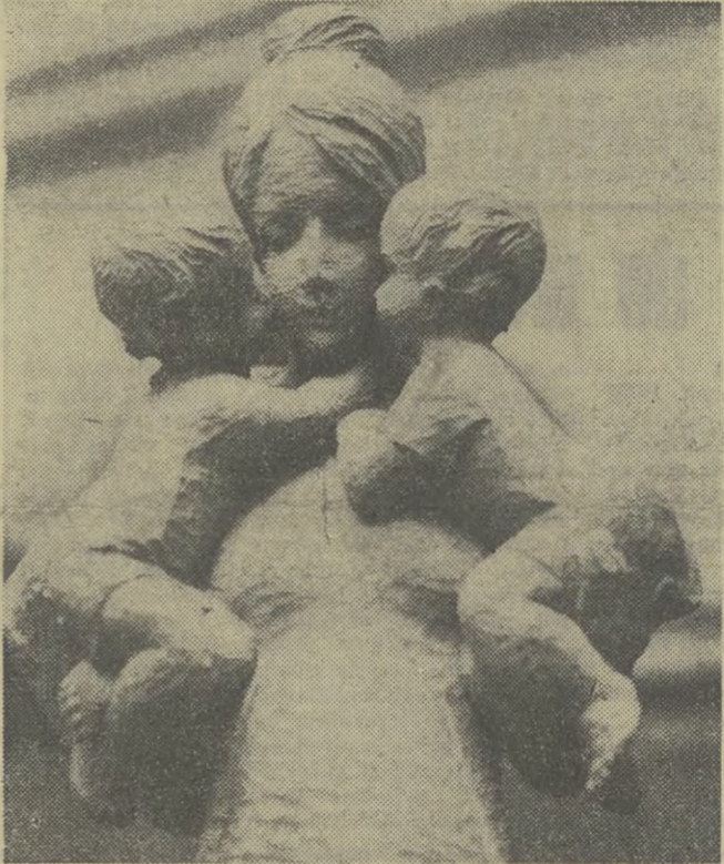
„Nasza kochana mama” — rzeźba w drewnie Aleksandra Szwerczka, prezentowana na 70 wystawie grupy twórczej „Zachęta”.

Nie lepiej było w innych regionach kraju. W Słupsku pierwsze plugi wyjechały na ulice rano 26 bm., ale zostały one przede wszystkim do torowania drogi ciężkim samochodom, z których posypywano solą jezdnie. I tak zaczęło się dziurawienie. (CIĄG DALSZY NA STR. 2)