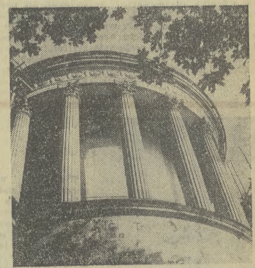
Świątynia Sybilli w Puławach — pierwsze polskie muzeum.