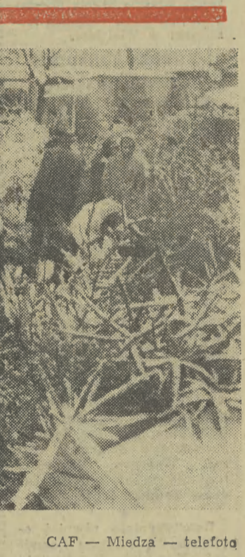
Komu choinkę...