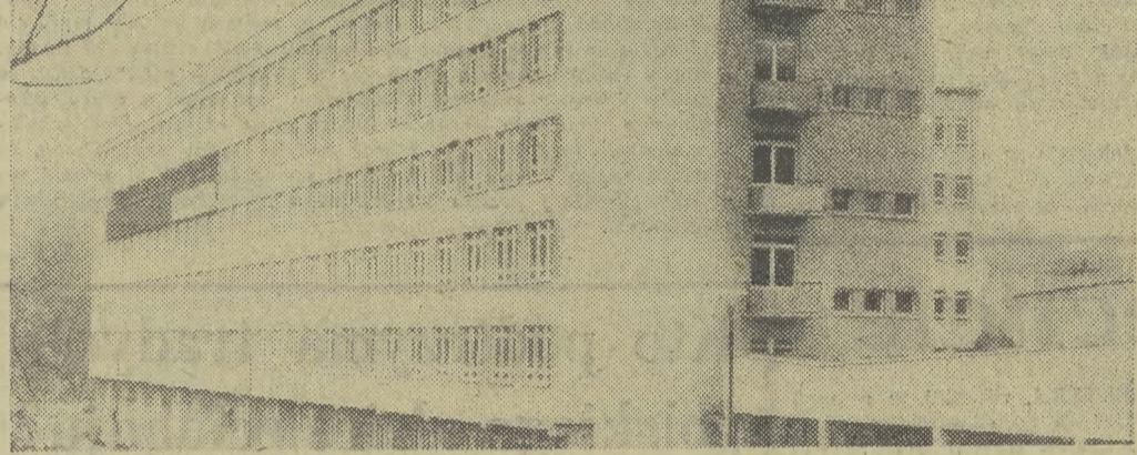
Limanowski szpital w całej okazałości.

Potrzeby oczywiście są daleko większe w każdej dziedzinie, na każdym odcinku. W otwartym programie tego województwa jest jednak miejsce dla inicjatyw i społecznych przedsięwzięć, których przecież w Krakowie nie brakuje. Wskazywał na nie dyrektor Zjednoczenia Budownictwa — Andrzej Zmuda, mówiąc o przedsięwzięciach zmierzających do przyspieszenia wykonawstwa planów mieszkaniowych i naczelnik Gdowa A. (CIAĞ DALSZY NA STR. 2)