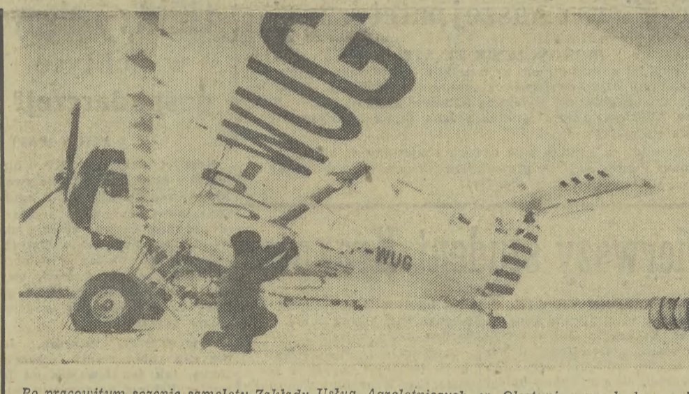
Po pracowitym sezonie samoloty Zakładu Usług Agrolotniczych w Olsztynie przechodzą w bazy generalny przegląd i zabiegi konserwacyjne.

W poniedziałek sąd we Florencji uwolnił — „z braku dowodów“ — jednego z przywódców mafii, Franks Coppole „Trzy Palce“ z zarzutów zorganizowania w 1973 r. próby zabójstwa prefekta, Angelo Magbano. Coppola (jego przydomek pochodził stąd, że kula rewolwerowa urwała mu 2 palce) został oskarżony o zorganizowanie zamachu i wynajęcie 2 zabójców.