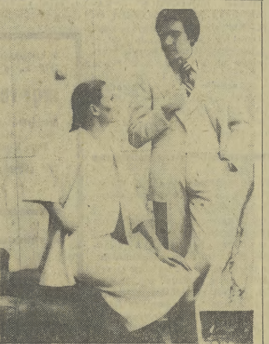
Tradycyjnie organizowane są w Warszawie pokazy mody Międzynarodowego Sekretariatu Włny — Woolmark. Na zdjęciu: modele z kolekcji polskiej. Tkaniny wyprodukowane zostały przez Zjednoczenie Przemysłu Włnianego „Podłanie“.

che-zbójca“ z Jean-Paul Belmondo i Claudią Cardinale. W programie rozrywkowym „Alewizja“ zobaczymy Irenę Kwiatkowską i Urszulę Sipin-ska. W świąteczną sobotę miłośnicy westernów o-bejrzą utwór Henry Hathaway'a „Z piekła do Tekساسu“, atrakcją innego amerykańskiego filmu — „Bogate biedactwo“ z roku 1936 będzie udział uczesnego cudownego dziecka Hollywoodu — Shirley Temple. Telewizyjny Teatr Muzyki proponuje widowisko muzyczno-baletowe pt. „Jan Strauss“, zaś „Od charlestona do charlestona“ to tytuł rozrywkowego programu z cyklu „Zaproszenie do tańca“. W drugim dniu świąt „Stare Kino“ przypomni (DOKOŃCZENIE NA STR. 2)