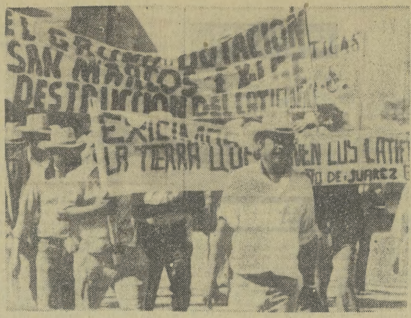
W Juan Jose Rios w Meksyku odbyła się demonstracja okolicznych rolników, domagających się przeprowadzenia w tym kraju reformy rolnej.

Problemy, wiążące się z rozwojem tarnowskiej organizacji partyjnej, są systematycznie analizowane przez kierownictwo wojewódzkiej instancji PZPR. Będą one nadal podejmowane w trakcie bieżącej działalności tejże instancji. (AL)