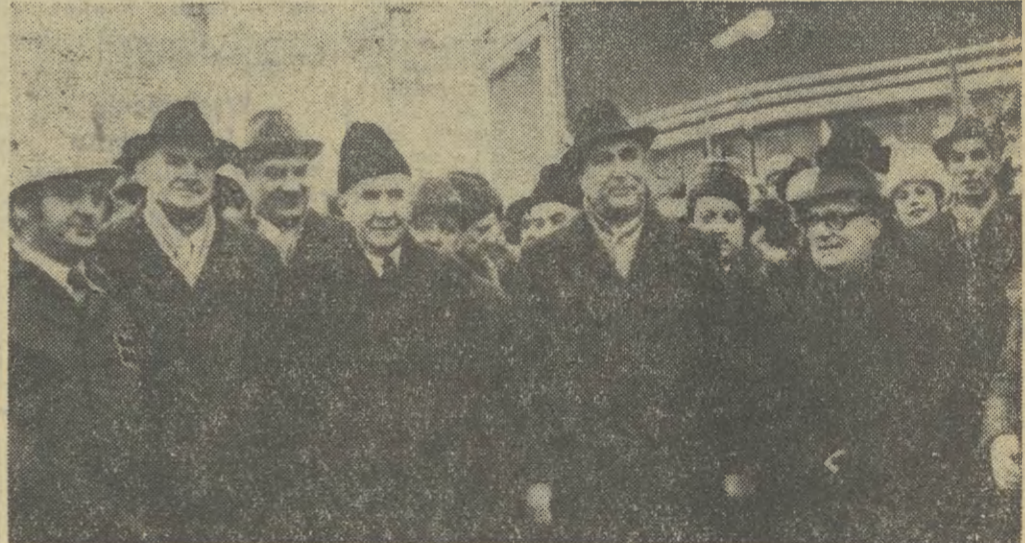
14 bm. w kombinacie metalurgicznym Huta „Katowice” przebywali I sekretarz KC PZPR Edward Gierka oraz członek Biura Politycznego i Sekretariatu KC. Obecna była także rządowa delegacja radziecka z premierem Aleksiejem Kosyginem.

Teksty wystąpień E. GIERKA i A. KOSYGINA oraz list budowniczych i załogi Huty „Katowice” do L. BREŻNIEWA zamieszczamy na str. 3.