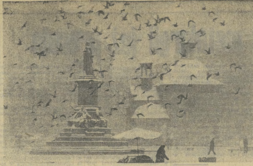
Zimowy łaniec krakowskich gołębi.

HANOI (PAP). We wtorek, 14 bm. rozpoczął się IV Zjazd Partii Pracujących Wietnamu — pierwszy w zjednoczonym kraju. Otwarcie obrad nastąpiło w gmachu Zgromadzenia Narodowego, na historycznym placu Ba Dinh, gdzie w 1945 roku prezydent Ho Chi Minh proklamował niepodległość Wietnamu Północnego. Na sali zasiadło ponad tysiąc delegatów, reprezentujących półtora miliona członków partii, tej wielkiej armii komunistów wietnamskich, która przeszło 46 lat temu stała się rewolucyjną awangardą narodu, a obecnie po zwycięstwie w walce przeciwko kolonializmowi znalazła się w pierwszych szeregach budowniczych socjalizmu. Obrady otworzył najstarszy delegat, prezydent Socjalistycznej Republiki Wietnamu, 68-letni Ton Duc Thang. Na zjazd przybyło około 30 delegacji partii komunistycznych i robotniczych z wielu krajów, a także organizacji i ruchów narodowo-wyzwoleńczych. Jest wśród nich delegacja PZPR pod przewodnictwem członka Biura Politycznego, sekretarza KC PZPR, Stanisława Kani. Przedstawiciele Komunistycznej Partii Chin nie przybyli na IV Zjazd PPW.