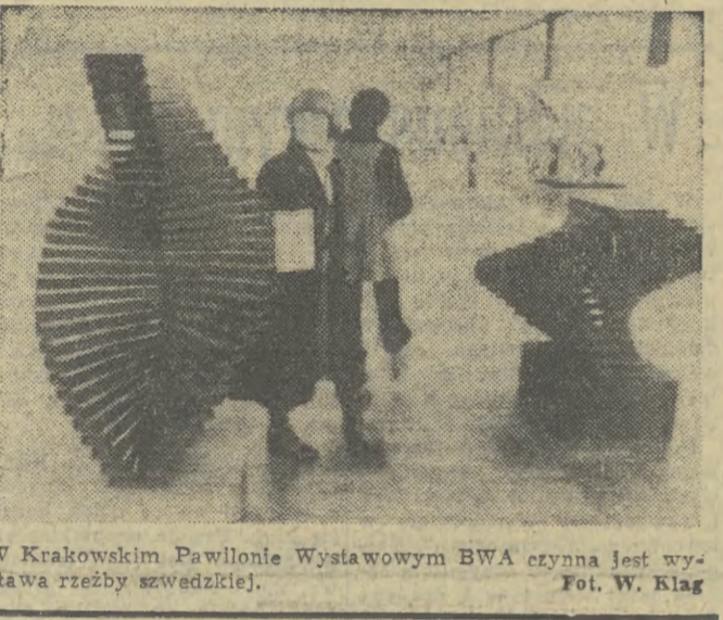
W Krakowskim Pawilonie Wystawowym BWA czynna jest wystawa rzeźby szwedzkiej.

We wtorek na Kremlu odbyło się spotkanie sekretarza generalnego KC KPZR, Leonida Breżniewa z I sekretarzem KC MPR, przewodniczącym Prezydium Wielkiego Churału Ludowego MRL, Jumdagijnem Cedenbaem, który przybył do Związku Radzieckiego z wizytą przyjacielską. L. Breżniew i J. Cedenbał wyrazili zadowolenie z powodu rozwoju szerokiej współpracy między obu partiami i państwami. Podkreślili znaczenie pomyślnej realizacji porozumień, osiągniętych podczas niedawnej wizyty w Związku Radzieckim mongolskiej delegacji partyjno-państwowej. Poruszono także różne problemy międzynarodowe. Tego samego dnia na Kremlu J. Cedenbał wręczył L. Breżniewowi Złotą Gwiazdę Bohatera MRL i Order Suche-Batora. Te najwyższe odznaczenia mongolskie L. Breżniew otrzymał za wielkie zasługi w budowie komunizmu w ZSRR, w obronie i w pomnażaniu sił i potęg światowego socjalizmu, w utrwaleniu jedności i zwartości międzynarodowego ruchu komunistycznego i robotniczego, za wybitny wkład w zacieśnianie braterskiej przyjaźni i pogłębianie wszechstronnej współpracy między KPZR i MPR, między ZSRR i MRL, jak również za pełną inicjatywę i owocną działalność w walce o pokój i bezpieczeństwo narodów.