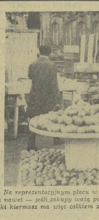
Na reprezentacyjnym placu w centrum Poznania można o 10 proc. taniej kupić warzywa i owoce, a nawet - jeśli zakupy ważą ponad 20 kg - zapełnić sobie bezpłatny transport do domu. Poznański kiermasz ma więc całkiem zrozumiałe powodzenie. Może by podobny zrobić i u nas.

WARSZAWA (PAP) Przygotowania do VIII Kongresu Związków Zawodowych, który za miesiąc zbierze się w Warszawie, były 10 bm. tematem ostatniego w tej kadencji, XIX posiedzenia plenarnego CRZZ. Plenum zaakceptowało przedstawione przez Władysława Kruczkę tezy referatu programowego, jaki zostanie wygłoszony na Kongresie. Uczestnicy obrad ocenili dotychczasową dyskusję nad projektem uchwały VIII Kongresu oraz przebieg ostatniego etapu kampanii sprawozdawczo-wyborczej: 49 wojewódzkich konferencji międzypowiatkowych i 23 krajowe zjazdy związków branżowych. W konferencjach i zjazdach uczestniczyło łącznie przeszło 10 tys. delegatów. W wyniku wyborów WRZZ i Zarządów Głównych ok. 70 proc. składów tych instancji - to nowi działacze.