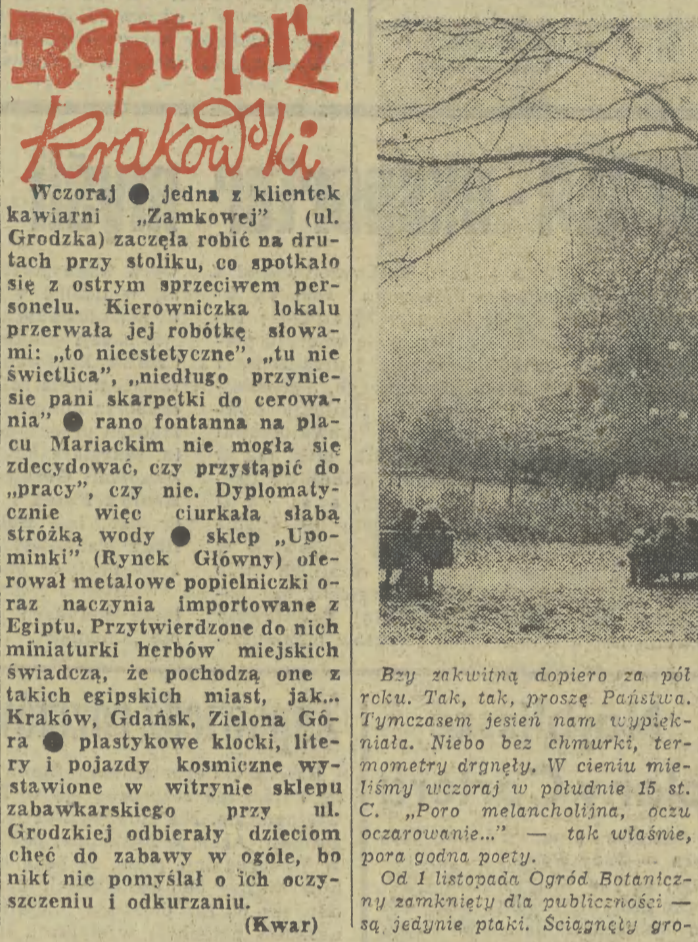
Był zakwitną dopiero za pół roku. Tak, tak, proszę Państwa. Tymczasem jesień nam tyje...

świadectwa kwalifikacyjnego, egzaminu z przepisów sanitarnych oraz niekaralność za przestępstwa z chęci zysku. Większe szanse mają posiadający odpowiednie pomieszczenia, możliwość bowiem przysiadła lokalni przez urzędy są ograniczone. Stosunkowo najprościej można zostać właścicielem straganu o wocowo-warzywnego. Należy się liczyć z ewentualnością poszerzenia sieci sklepów spożywczych na nowych osiedlach i wsiach o kioski, ba nawet pawilony prywatne. Z przebiegu dyskusji wynika, że i na to są reflektanci. Dopuszcza się także możliwość przejścia przez osoby prywatne małych sklepów uposażonych. Nie ogranicza się asortymentu sprzedawanych towarów ani źródeł zaopatrzenia. Co do gastronomii szczególnie wypytano o możliwości uruchamiania placówek przy ruchliwych szlakach komunikacyjnych oraz w miejscowościach o charakterze wypoczynkowo-rekreacyjnym. Zwracano uwagę na możliwość adaptacji starych a opuszczonych młynów, zajazdów, dworców. Preferencje dotyczą również uruchamiania zakładów wędliniarskich i garmażeryjnych. Oferuje się kandydatom pomoc w zakupie maszyn i urządzeń oraz zapewnienie dostawy surowca, przede wszystkim podrobów mięsnych. Producceni będą mieli także prawo prowadzenia sprzedaży detalicznej. Akcję patronuje Izba Rzemieślnicza oraz Zrzeszenie Prywatnego Handlu i Usług, tam też można zasięgnąć szczegółowych informacji. Szerokie udogodnienia i ulgi stwarzają dobry klimat a ważne jest jeszcze to aby tryb załatwiania formalności był rzeczywistie uproszczony. (tor)