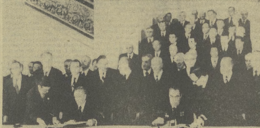
Edward Gierek i Leonid Breżniew podpisują wspólne oświadczenie.

Uroczystość podpisania wspólnego oświadczenia O godz. 12.30 czasu moskiewskiego w reprezentacyjnej, za- bytkowej Sali Władimirowskiej w Wielkim Pałacu Kremlo- wskim, odbyła się uroczystość podpisania przez przywódców Polski i Związku Radzieckiego wspólnego oświadczenia - O dalszy rozwój wszechstronnej współpracy między Polską Rze- czpospolitą Ludową a Zwią- zkiem Radzieckim i o umacnie- nie przyjaźni między narodem polskim a narodem radzieckim.