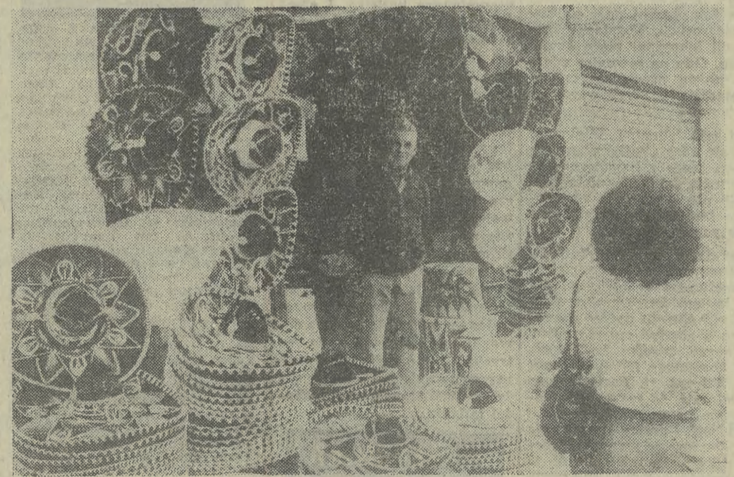
MEKSYK. Tradycyjne sombryera produkowane dla tzw. masowych turystów są sprzedawane na liczących bazarach, we wszystkich miastach kraju.

HAWANA (PAP). Odkrycie nowych złóż ropy naftowej w Meksyku zwiększa znane rezerwy cennej surowca energetycznego w tym kraju o około 20 procent. Tak oceniają specjaliści nowe odkrycia na polu meksykańskiej ropy. Meksykańskie towarzystwo naftowe podało, iż nowe, bogate złoża węglowodorów odkryto w stanie Tabasco na południu kraju. Jednocześnie obfite pokłady gazu ziemnego zlokalizowano na północy Meksyku, w stanie Coahuila. Według dotychczasowych ocen, meksykańskie rezerwy ropy i gazu miałyby wynosić 45 800 milionów baryłek.