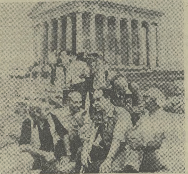
ZSRR. Jeden z najcenniejszych zabytków starej architektury Armenii, świątynia Gerni w stylu rzymskim z I wieku n.e. Jest tłumnie odwiedzana przez turystów.

WARSZAWA (PAP). Z okazji święta narodowego Królestwa Nepalu, przypadającego w dniu 28 bm., przewodniczący Rady Państwa Henryk Jabłoński wystosował depeszę gratulacyjną do króla Nepalu Birendry.