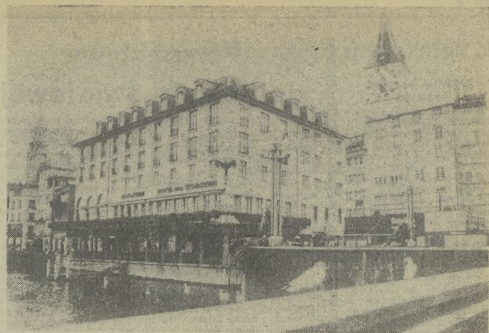
OBIEKTYWEM PRZEZ ŚWIAT. Szwajcaria — Zurych.

głęboko sprzeczne z Aktem Końcowym KBWE. Większość mieszkańców Grecji z oburzeniem przyjęła postanowienia NATO o rozmieszczeniu w Europie Zachodniej amerykańskich rakiet średniego zasięgu. Zmierzają one do wzmocnienia wyścigu zbrojeń i zmiany stosunku sił — oświadczył w wywiadzie dla węgierskiego dziennika „Nepszabadsag” sekretarz generalny KC Komunistycznej Partii Grecji Charilaos Florakis. W Grecji rozwinął się szeroki ruch protestu przeciwko rozmieszczeniu nowych rakiet w Europie Zachodniej. W ciągu miesiąca zebrano ponad milion podpisów.