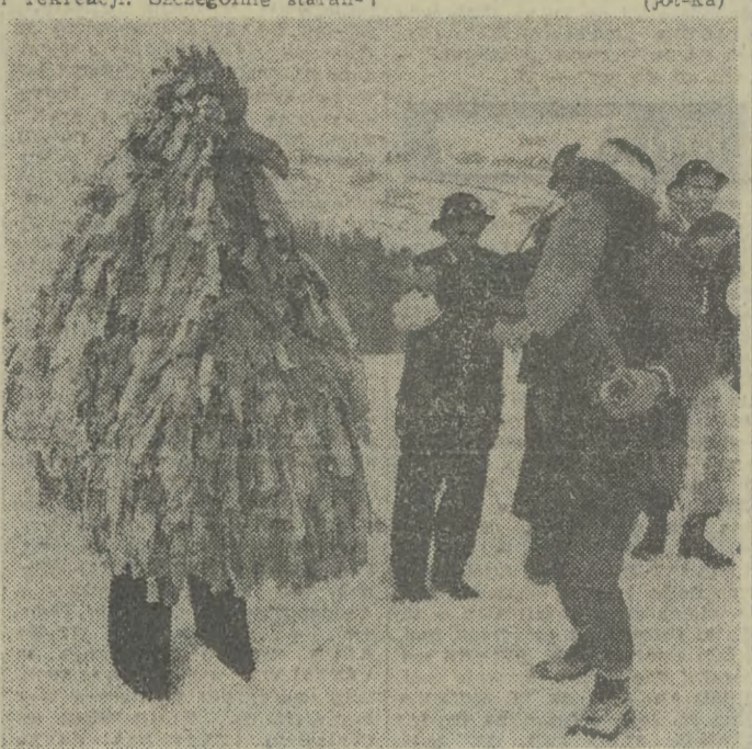
Kolejniczy ze wsi Łososina Górna koło Limanowej. Zespoły regionalne to też jedna z atrakcji nowosądeckich.

nomowanych miejscowościach turystycznych przewiduje się w okresie świątecznym — miejsca na bałe sylwestrowe są już w zasadzie zajęte. Natomiast w sezonie zimowym do 18 stycznia po 20 lutego przyszłego roku organizatorzy turystyki dysponują jeszcze ok. 10 tysiącami miejsc. Lepiej niż zwykle zapakowane są w spręż turystyczny sportowy wypożyczalnie WPGT i terenowych ośrodków sportu i rekreacji. Szczególnie starannie