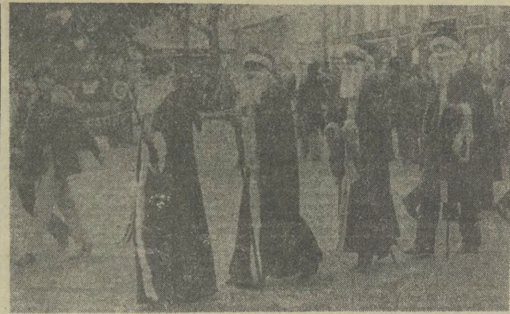
Węgry. Na budapeszteńskich ulicach pojawiła się grupa Świętych Mikołajów zbierających zamówienia na gwiazdkowe prezenty.