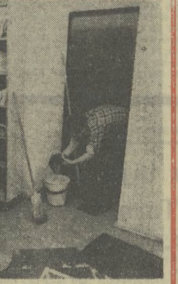
Woda zalewa magazyny księgarski „Pod Globusem”!