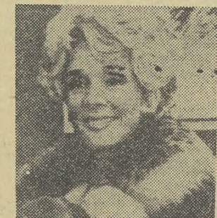
Ello Petriego. Niewątpliwie ozdoba obrazu jest udział Marcello Mastroianniego który stworzył w filmie świetną kreację człowieka kierującego się w życiu wyłącznie własnymi korzyściami, typowego drobniem-szczucha-konformisty. Oskarżony niespodziewanie o mord-derstwo kobiety, z którą łączyły go wspólne interesy, ale także przelotne eskapady miłosne, bohater jest przerażony i wstrząśnięty, poczyna obnażać się moralnie przed przesuwanym go komisarzem policji. Partnerką Mastroianniego jest w filmie znana aktorka francuska Micheline Presle. (Pr. I)