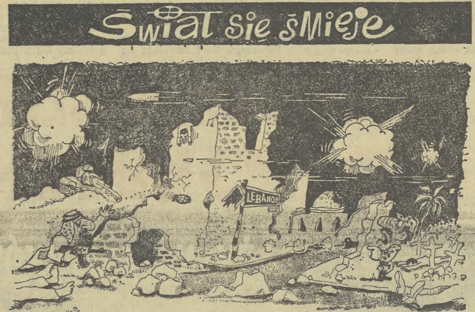
„Pokoju mediacje” w Libanie — w oczach karykaturzysty „Newsweeka”.

Wiem jego kontrkandydat Ronald Reagan, były gwiazdor Hollywoodu, do końca prowadził bezpartijną batalię o głosy delegatów i jak utrzymują komentatorzy — miał w tej walce spore szanse. Porażka Reagana jest równocześnie porażką skrajnej prawicy amerykańskiej, która w tegorocznej kampanii wyborczej czyniła wszystko aby przeciwdziałać odprężeniom tendencjom na świecie i sprowadzić politykę zagraniczną USA na zimnowojenne tory. Górę wziął jednak zdrowy rozsądek.