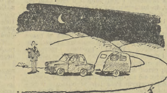
rys. Z. ZIOMEK

cji fabryk domów (a co za tym idzie stworzenie możliwości budowania ładniejszych mieszkań, domów i osiedli) jest nie tylko możliwe, ale wręcz niezbędne”. Ekonomia — podkreśla „Życie Gospodarcze” — to sprawa poważna! • Teresa Brodzka w „ZYCIU WARSZAWY”: „Na ciuchach w Rembertowie para dzinsów kosztuje