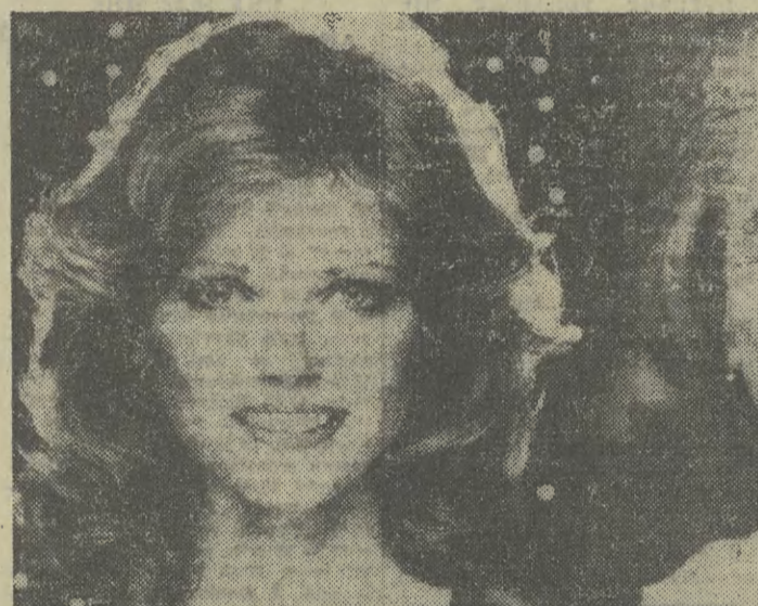
Jak bardzo zmienia kobiecą twarz zreca charakterystyka! Oto 31-letnia modelka Cheryl Tiegs, przed i po trzygodzinnej sesji... Ciekawe, czy kiedy Cheryl Tiegs będzie w wieku lat siedemdziesięciu — uda się zabieg odwrotny?

szych wskaźników w Europie. 6 nowych zespołów zamierza się uruchomić w 1981 roku. Podwyższy to udział energii nuklearnej do 45 proc. Wśród produujących państw w tej dziedzinie znajduje się również Francja — 15 elektrowni atomowych pokrywa 13,5 proc. zapotrzebowania na energię. Kraj ten wysunął najwybitniejszy program rozwoju energetyki atomowej. Zapowiedziano budowę 33 elektrowni nuklearnych i do 1987 roku udział źródła atomowych w całości zasobów energetycznych wzrośnie do 60 proc. Szwajcaria — 4 elektrownie