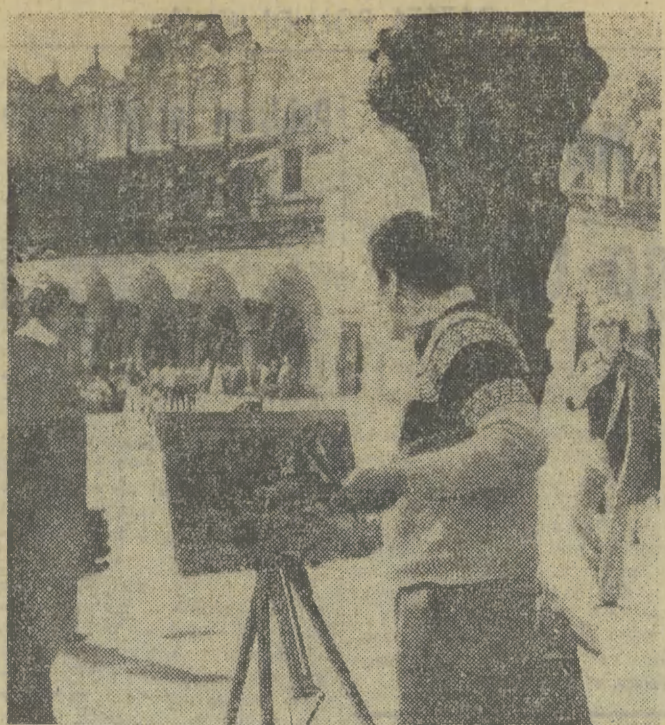
Jak za dawnych lat na krakowskim Rynku Głównym od czasu do czasu pojawiają się artyści malarze aby utrwalić niezaprzeczalny urok starego miasta.

Przedstawione sprawy, jak również inne, mogłyby — zdaniem (DOKOŃCZENIE NA STR. 2)