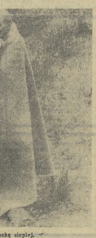
Wreszcie trochę ciepłej.

GDANSK (PAP). Sopot już w pełni żyje III festiwalem „Interwizji”. „Grand-hotel”, będący główną bazą imprezy, obiegają łowcy autografów. Na miejscu są niemal wszyscy wykonawcy i inni goście festiwalowi. W Operze Leśnej trwają próby orkiestr — rozrywkowej Polskiego Radia i Telewizji z Poznania pod dyktando Zbigniewa Górnoego i Orkiestry Taneznej Radia Berlin pod dyktando Guentera Gollascha z solistami i zespołami wokalnymi. Ekipy techniczne przekształciły zaplecze Opery Leśnej w ogromne studio telewizyjne, dysponujące możliwościami bezpośredniego przekazu, rejestracji programów, emisji filmów z telekina. Trwają również imprezy towarzyszące spokojnemu festiwalowi. W gdańskim Domu Technika przedstawiono kolejne widowiska uczestniczące w konkursie III Przeglądu Programów Rozrywkowych „Interwizji”.