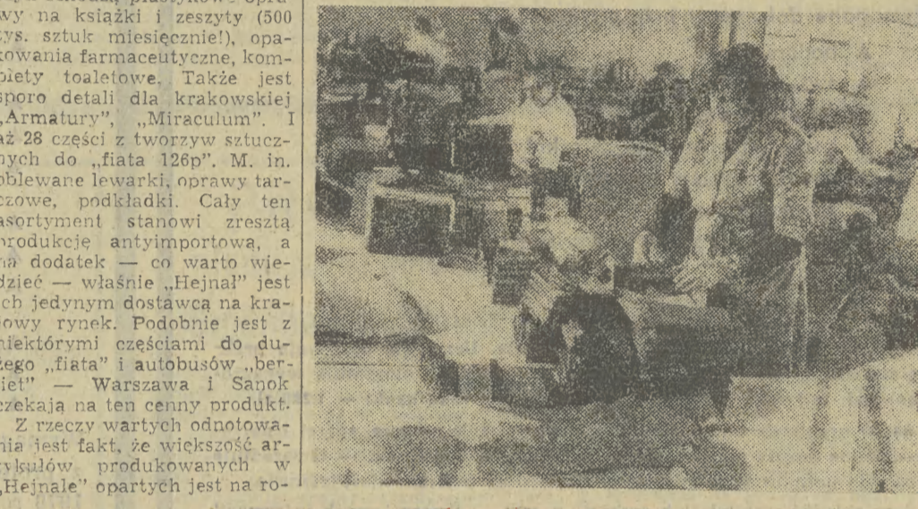
Pracownicy Zakładu Produkcyjnego Spółdzielni Inwalidów „Hejnal” przy ul. Przewóz w Płaszowie.

Historia Chemicznej Spółdzielni Inwalidów „Hejnal” jest długa. Jeśli jednak przez lata produkcja miała miejsce w rozlicznych lokalach na terenie miasta, to od roku 1971 prowadzi się ją w jednym zakładzie — przy ul. Przewóz (w Płaszowie). Prezes Stanisław Dudzicki — od 16 lat kierujący Zakładem — opowiada nas po halach produkcyjnych; z maszyn schodzą plastikowe oprawy na kłaski i zeszyty (500 tys. sztuk miesięcznie), opakowania farmaceutyczne, komplety toaletowe. Także jest sporo detali dla krakowskiej „Armatury”, „Miraculum”. I aż 28 części z tworzyw sztucznych do „fiata 126b”. M. in. oblane lewarki, oprawy tarczowe, podkładki. Cały ten asortyment stanowi zresztą produkcję antyimportowa, a na dodatek — co warto wiedzieć — właśnie „Hejnal” jest ich jedynym dostawcą na krajowy rynek. Podobnie jest z niektórymi częściami do dużego „fiata” i autobusów „berliet” — Warszawa i Sapok czekają na ten cenny produkt. Z rzeczy wartych odnotowania jest fakt, że większość artykułów produkowanych w „Hejnalu” oparty jest na ro-