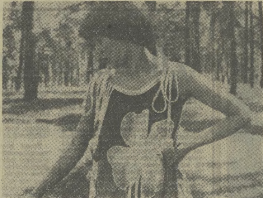
Członkowie Związku Artystów Plastyków „Art” w Łodzi projektują i wykonują piękne kracje z włókien naturalnych m. in. bawełny i wełny.