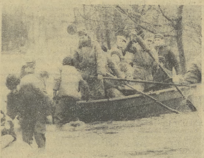
Wylew Warty w woj. konińskim. Saperzy przewożą pontonami i łodziami ludność zalanych dzielnic Koła.

Bardzo trudna sytuacja utrzymuje się w rejonie Konina. Wprawdzie lewobrzeżna część miasta nie została podtopiona (DOKOŃCZENIE NA STR. 2)