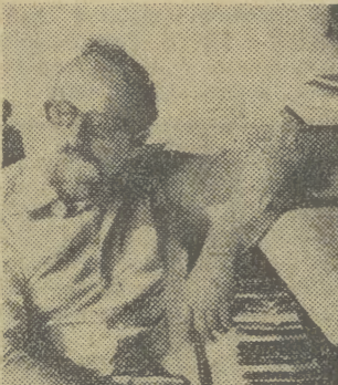
— Co ma Pan w dalszych planach?

— W Polsce jestem jeszcze do niedzieli, 18 bm. W tym dniu wyjeżdżam do Montrealu, aby wziąć udział w zorganizowanym tam tygodniowo koncertów mojej muzyki. Potem bezpośrednio pojadę do Japonii, gdzie odbędą się koncerty muzyki Szostakowicza, oraz moich utworów. Najprawdopodobniej 19 kwietnia wyjadę z Japonii. — W Stuttgarcie zapowiada się niedługo „Festiwal Muzyki Krzysztofa Pendereckiego”? — Tak. Pod koniec kwietnia i w początkach maja br. pojadę do Stuttgartu.