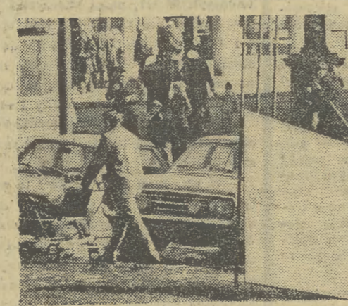
„Reklama” pod Wawelem.