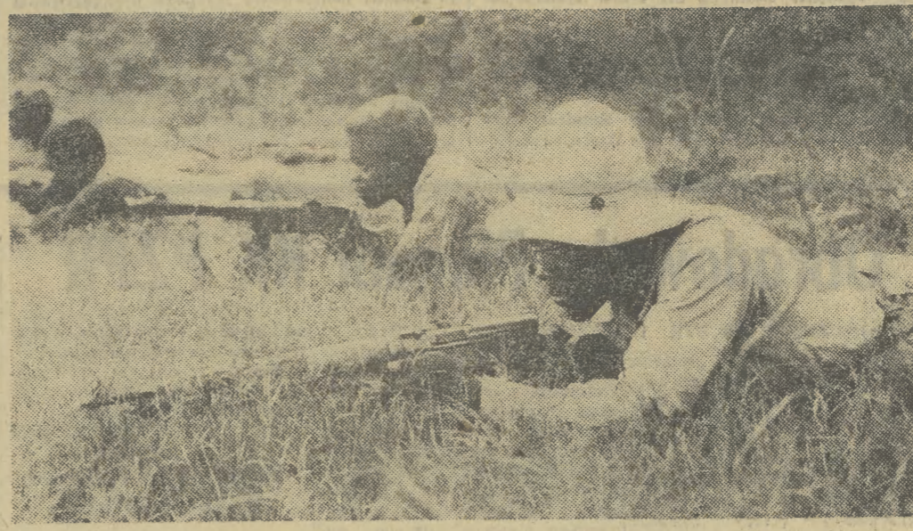
Jeden z oddziałów SWAPO w akcji.

Funkcjonowanie handlu i gastronomii „Spolem” było tematem wystąpienia Eugeniusza Tarczyńskiego. 5600 skarg, w (DOKOŃCZENIE NA STR. 2)