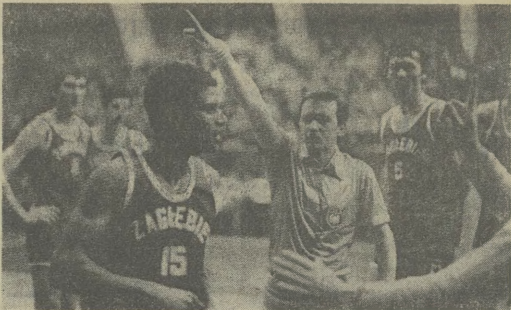
W tym momencie zawodnik „Zagłębia” z nr. 15 został usunięty z parkietu za wywołanie bójki.

Lech Poznań pokonał Widzew Łódź 6:5 (1:1). Bramki zdobyli: dla Lecha — Pawlak — 25 min., dla Widzewa — Pieta — 5 min. Wykonawcami celnych rzutów karnych dla Lecha by-