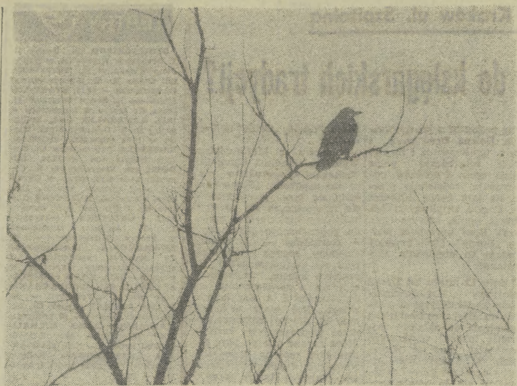
Czekam na wiosnę...

Warto dodać, że prasa amerykańska pełna jest publikacji na temat SALT II. Podkreśla się, że za szybkim osiągnięciem tego porozumienia opowiada się ponad 80 proc. Amerykanów.