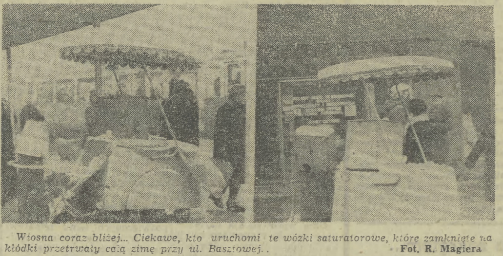
Wiosna coraz bliżej... Ciekawe, kto uruchomi te woźki saturatorowe, które zamknęły na kłódki przetrwały całą zimę przy ul. Baszowej.

Wesoraj: ulica Krowoderskich Zuchów przypomina swoim wyglądem bajro. Woda bowiem nie ma odpływu z powodu zatkanych studzienek ściekowych — szybki pociągów podmiejskich są brudne, szczególnie tych kursujących do Wieliczki — skarżą się pasażerowie — pan sprzedający kwiaty na placu w pobliżu Halli Targowej oferował panom tulipanów po 25 zł sztuka. Mężczyźni, którzy też chcieli je kupić, musieli płacić o 5 zł drożej. Ładnie... — na kiosku stojącym obok „Domu Turysty” umocowano neon (świeci niepotrzebnie cały czas) informujący, że sprzedaje się tutaj gofry — motorniczy „12” jadący z Widoku (parę minut po północy) wywiesił tabliczkę informacyjną, że jedzie do Łagiewnik, do zajezdni. Ludzie, jak to ludzie, w dalszym ciągu nie rozumieli co o tym myśleć i... Informowali więc osobście: „A co myślicie, że do Rakowice ciągle będą teździł, też się chce wypaść”. (LW)