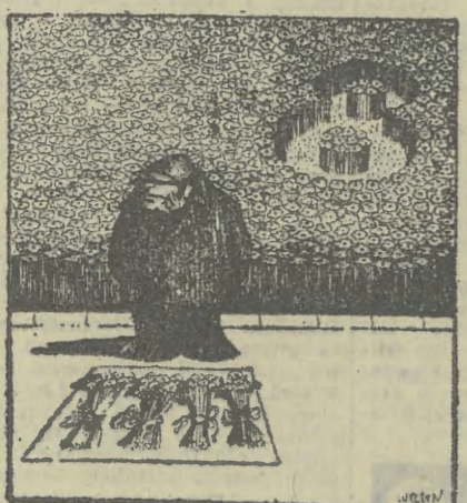
Rys. E. LUTCZYŃ