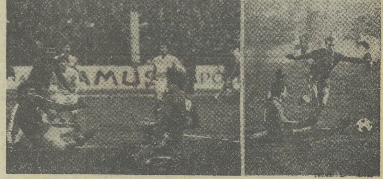
Nawalka strzela pierwszego gola; za chwilę po podaniu Wróbla padnie druga bramka.