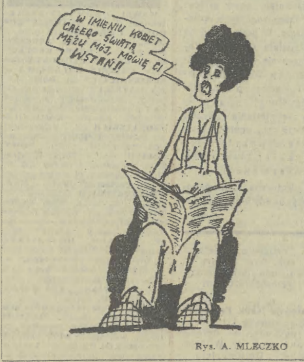
Rys. A. MLECZKO