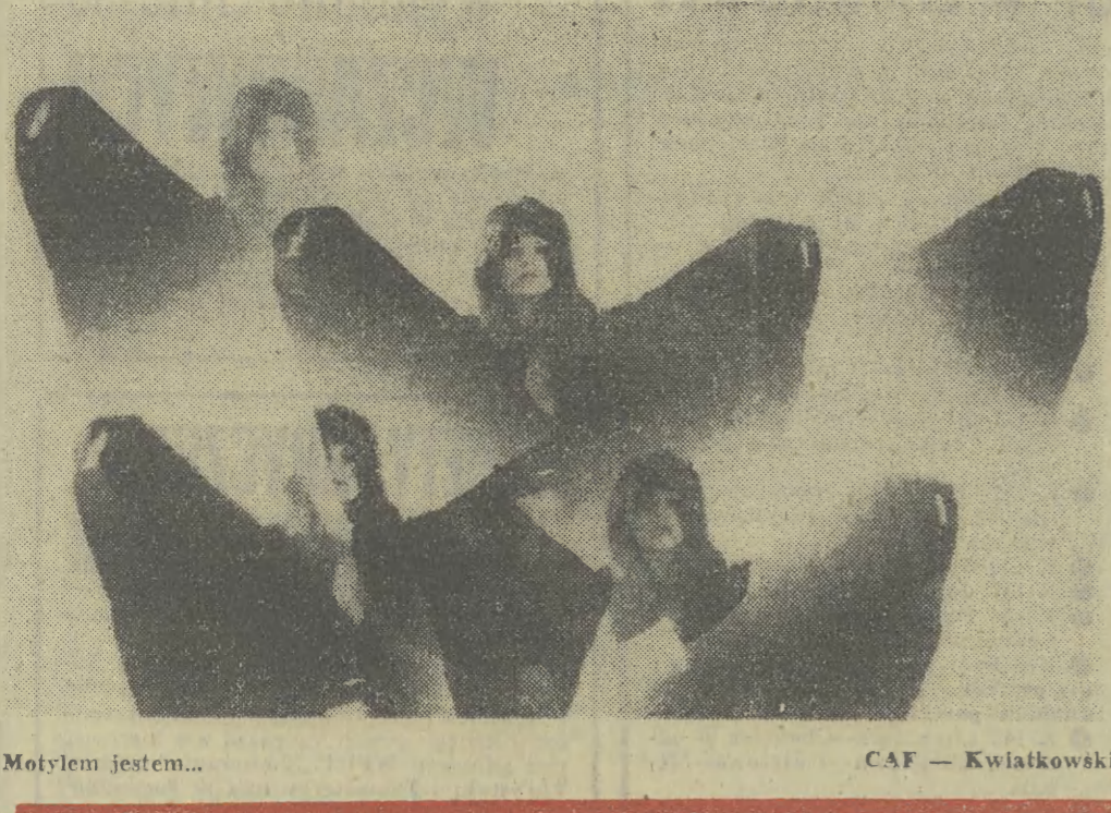
Motyłem jestem...

To, co można już okiem „Voyagera-1” dojrzeć na odległej jeszcze powierzchni Jowisza, jest, zdaniem naukowców, bardzo interesujące. Kamery sondy wiodą z wolna swymi obiektywami po różnych częściach planety ukazując równinową „Czerwona plama”, jak też na biegunach białawe czapy chmur, które przesuwają się z ogromną szybkością w różnych kierunkach. Uczni są już w stanie odróżnić szczegóły od 40 do 7 kilometrów — zależnie od momentu. Dochodzą oni do wniosku, że Jowiszowa „czerwona plama” jest rozszalałym żywiołem, który przelewa się aż ponad białe czapy. Nie wiadomo jeszcze, dla-