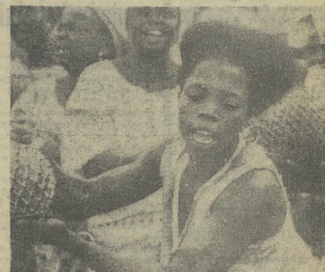
Luźna Republika Beninu. Egzotyczna szlachetna s Portu Neve.

Rząd w Tel-Awiewie bezprawnie zajął ziemie należące do Arabów na południe od Nablusu na zachodnim brzegu Jordanu i rozpoczyna tam budowę nielegalnego osiedla żydowskiego. Ziemie te są najżywniejszymi w tym rejonie. Izraelski dziennik „Jerusalem Post” swymczasem, że decyzja ta ogłoszona w momencie gdy toczą się rokowania egipsko-izraelskie może mieć fatalny wpływ na rozwój sytuacji.