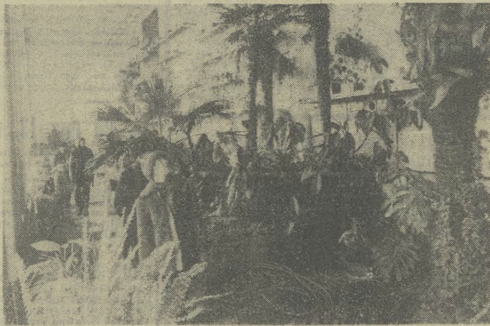
Razienkowska Palmiarnia Kyle własnym, egzotycznym życiem. Wierzy się nie chce, że na cienką szklaną ścianą jest jeszcze zima...

Konferencja rozpatruje również problemy związane z handlem i kooperacją przemysłową między krajami o różnych systemach społeczno-politycznych. Uczestnicy w obradach delegacji podkreślili żywe zainteresowanie swych krajów rozszerzeniem frontu współpracy gospodarczej, wymiany naukowo-technicznej i współpracy przemysłowej między Wschodem a Zachodem, zgodnie z postanowieniami Aktu Końcowego Europejskiej Konferencji Bezpieczeństwa i Współpracy. Podkreślono, że przełom w rozwoju handlu i współpracy będzie można osiągnąć tylko pod warunkiem pełnej i ostatecznej eliminacji wszelkich ograniczeń i utrudnień w zakresie importu towarów z krajów socjalistycznych przez kraje kapitalistyczne.