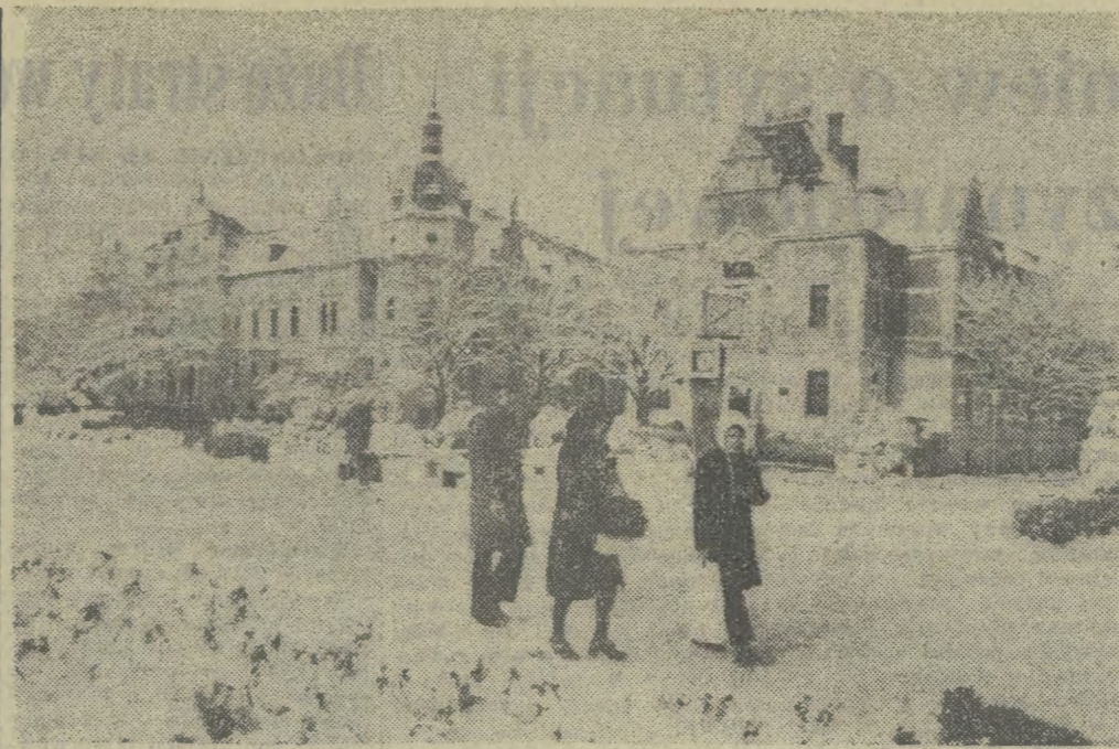
RUMUNIA. Zima w Polana Brasov, popularnym ośrodku sportów zimowych. Na drugim planie kamieniczny rynek — pochodzące z początku XV w.

Zgodnie z życzeniem papieża Jana Pawła II w sprawie odwiedzenia swej ojczyzny ustalony został termin jego podróży. Dostojny gość odwiedzi w dniach 2-10 czerwca 1979 r. Warszawę, Gniezno, Częstochowę i Kraków.