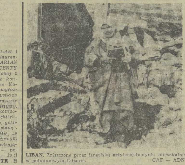
LIBAN. Zniszczone przez izraelską artylerię budynki mieszkalne w południowym Libanie.