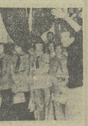
Zakończenie akcji NAZ w Tarnowie (po lewej) i w Krakowie.

ny, odnieść do obecności, „aktującą sprawunki itp. O przebiegu akcji ustaliśmy podczas sejmiku zastępowych, który stanowił jeden z punktów programu sobotniego zlotu zastępowych „8. Zimy na Medal” Chorągwi Tarnowskiej ZHP. W trakcie obrad — i wcześniej — funkcjonowała „Giełda pomysłów”, która rejestrowała wszystkie propozycje, zgłaszane z myślą o najbliższych walkach. W czasie gdy sejmikowali zastępowi, najmłodszy uczestnik zlotu bawił się „turniejem gier” na wolnym powietrzu, po czym w tzw. plener wybruszył zastępowi, ustępując miejsce w sali zlotu, zaproszonym na bal „U Królowej Zimy”.