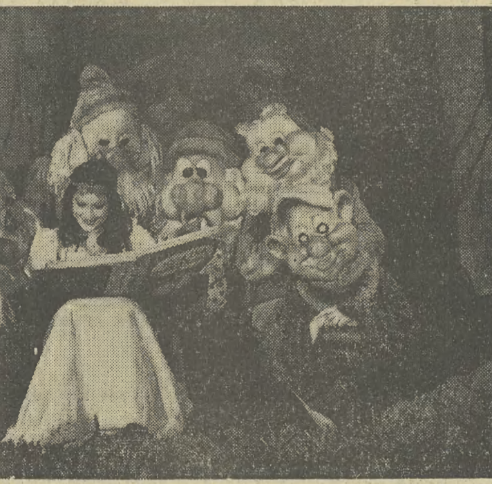
Znać? No to koniecznie obejrzyjcie jeszcze raz! Przepiękną baśń braci Grimm pt. „Królewna Śnieżka” przypomina obecnie w bardzo udanej inscenizacji krakowski Teatr Łalki i Maska „Groteska”. Dzisiaj o godz. 17 odbędzie się premiera prasowa tego barwnego widowiska muzycznego, połączona z ogłoszeniem wyników i wręczeniem nagród laureatom konkursu dla dzieci na plakaty... właśnie do „Królewny Śnieżki”. Otwarto też zostanie wystawa pokonkursowa. Organizatorami konkursu, który wśród najmłodszych cieszył się ogromnym powodzeniem, były Teatr „Groteska” i „Gazeta Południowa”. Na zdjęciu: fragment przedstawienia — Śnieżka wśród krasnali.