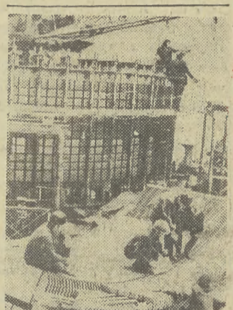
Budowniczości Ust-Ilmskiej Elektrowni Wodnej w obwodzie Irkuckim na czeskiej XXV Zjazdu KPZR zobowiązali się zmontować przedterminowo osmy agregat.

Obecnie inżynierowie pracują intensywnie nad oprogramowaniem tego komputera. Po walowni blach karoseryjnych, stalownia konwertorowa będzie drugim wydziałem skomputeryzowanym. Przed jej założą stoi więc poważne zadanie „dopasowania się” do komputera. (m-gl)