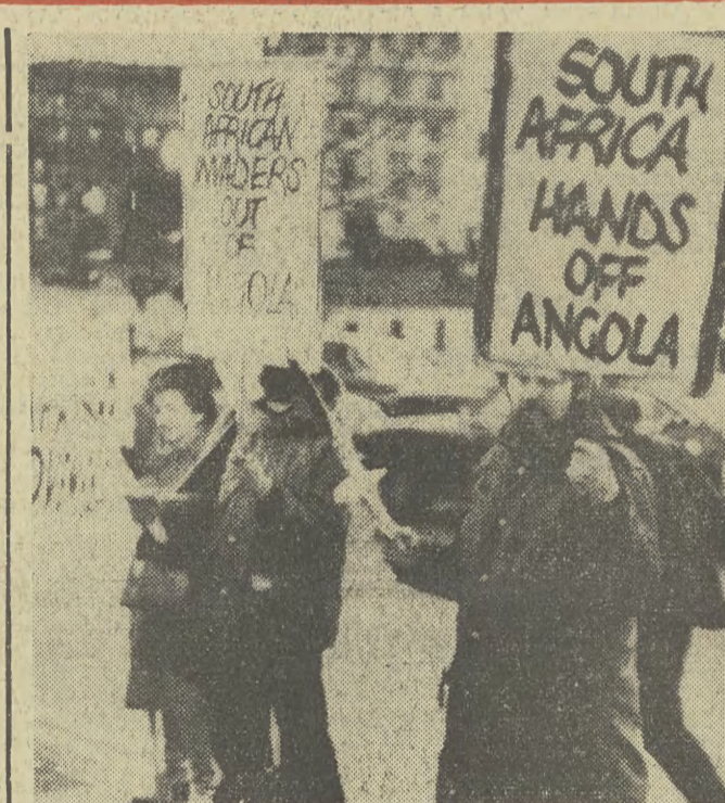
11 bm. w Londynie odbyła się demonstracja, której uczestnicy protestowali przeciwko udziałowi białych najemników z RPA w walkach w Angoli.

W czwartek w godzinach południowych do miejscowości Mas d'Artigny w pobliżu Nicei, przybył kanclerz RFN, Helmut Schmidt, na 2-dniowe konsultacje z prezydentem Francji Valerym Giscard d'Estaing. Według następujących oświadczeń, rozmowy koncentrowały się będą na następujących problemach: perspektywy koniunktury ekonomicznej w roku bieżącym, zarówno w stosunkach dwustronnych, jak i w skali całej Europy Zachodniej. Problemy europejskie, zwłaszcza zaś przyszłość EWG, stanowiąc będą drugi ważny temat. Ponadto nuklearna współpraca RFN — Francja oraz problemy walki z terroryzmem.