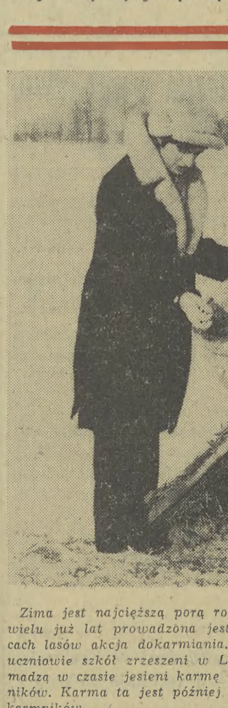
Zima jest najcięższą porą roku dla zwierzęcej leśnej. Od wielu już lat prowadzona jest więc z myślą o mieszkańcach lasów akcja dokarmiania. Myśliwi kół łowieckich i uczniowie szkół zrzeszeni w Lidze Ochrony Przyrody, gromadzą w czasie jesieni karmę przeznaczoną dla tysięcy psów-ników. Karma ta jest później systematycznie rozdawana do karmników.