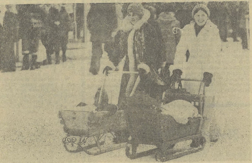
W Zakopanem pełnia sezonu zimowego. Krupki tradycyjnemu już są w tym okresie miejscem wielkiego pokazu mody — zarówno ubiorów, jak i sprzętu sportowego. W tym roku szczególnie uwagę zwracają nowe modele sanek dla dzieci. Wykonane jako miniaturowe prawdziwych sanek góralskich zachwycają bogactwem tradycyjnych ozdób regionalnych, bogato rzeźbionych w drewnie.

Jeśli inkasent obsługujący rejon, w którym zamieszkuje autor poprzedniego listu, zaniedba swoich obowiązków prądu i gazu, to należy tę sprawę uregulować. Na opór bowiem inkasenci wywiązują się sumiennie ze swoich obowiązków. M.D. (nazwisko znane Redakcji) Kraków