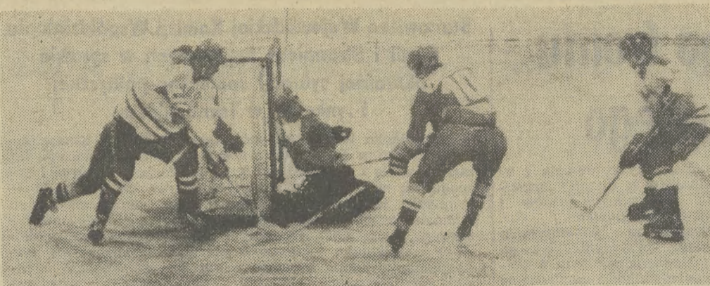
Nieoczekiwana porażka Podhala w Łodzi

21 czasu miejscowego, a więc w środku nocy naszego czasu. Przypominamy, że będzie to siódmy oficjalny mecz Polski i Argentyny, wygraliśmy tylko raz, przed siedmiu laty w Stuttgarcie 3:2, w pierwszym meczu pułk finałowej mistrzostwa świata 1974. W drużynie Argentyny nie wystąpi słynny Maradona. Piłkarz ten oświadczył, iż jest przemęczony ostatnimi licznymi występami w klubie i reprezentacji, i w związku z tym zaproponował trenerowi Menottiemu, że wystąpi przeciwko Polsce, ale nie weźmie udziału w zgrupowaniu przedmeczowym. Menotti — znany z twardej ręki nie przystał na to i Argentynicy wystąpią bez swojego asa. Ma zagrac natomiast przeciwko Polsce Kempes, bohater ostatniego Mundialu 78. Przypominamy, że latem tego roku, mistrzostwo świata gościł w Europie, wygrali z Valencią 1:0, z Herculesem Alicante (broni tu Tomaszewski) 2:0, z Fiorentiną 5:3 oraz przegrali z Barceloną 0:1. (ANS)